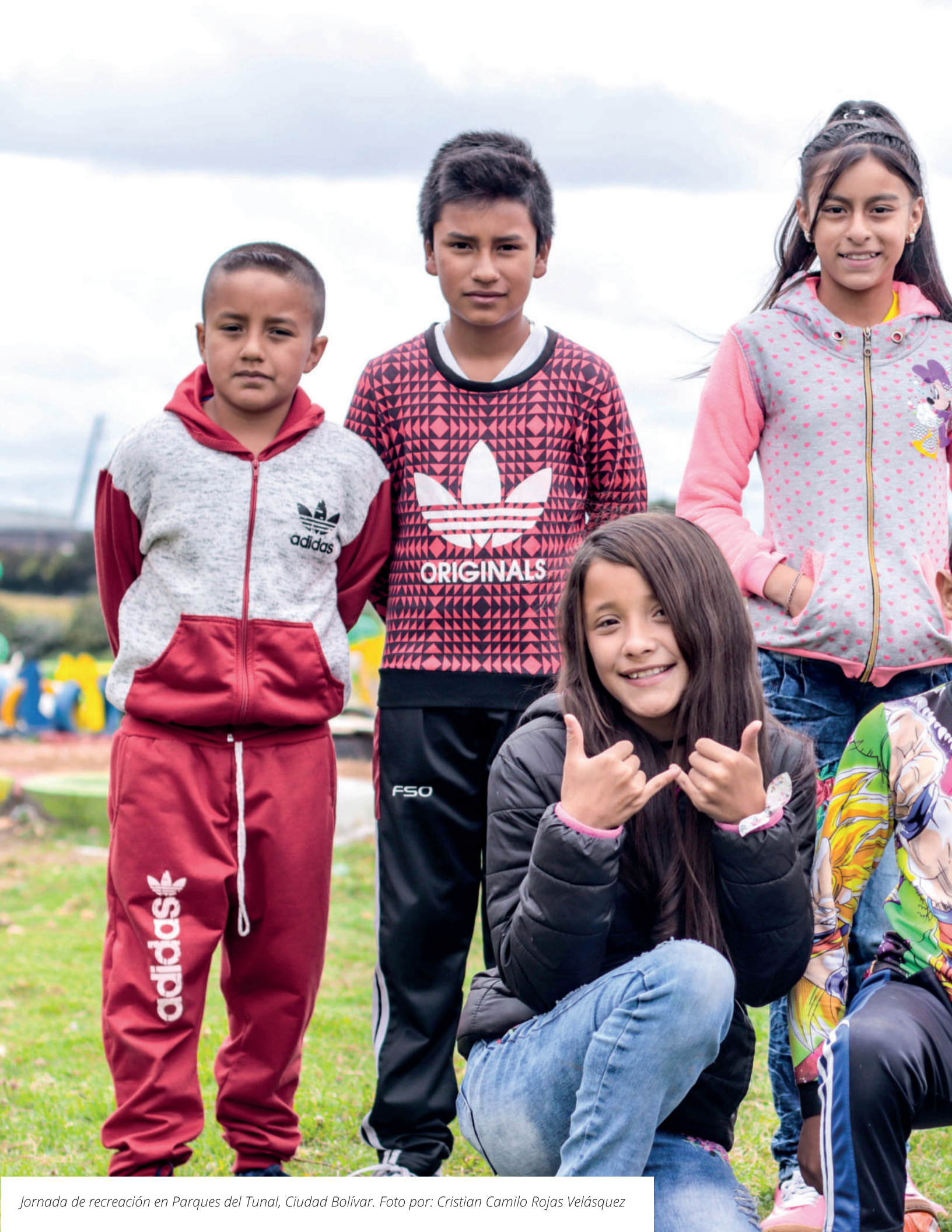
Jornada de recreación en Parques del Tunal, Ciudad Bolívar.