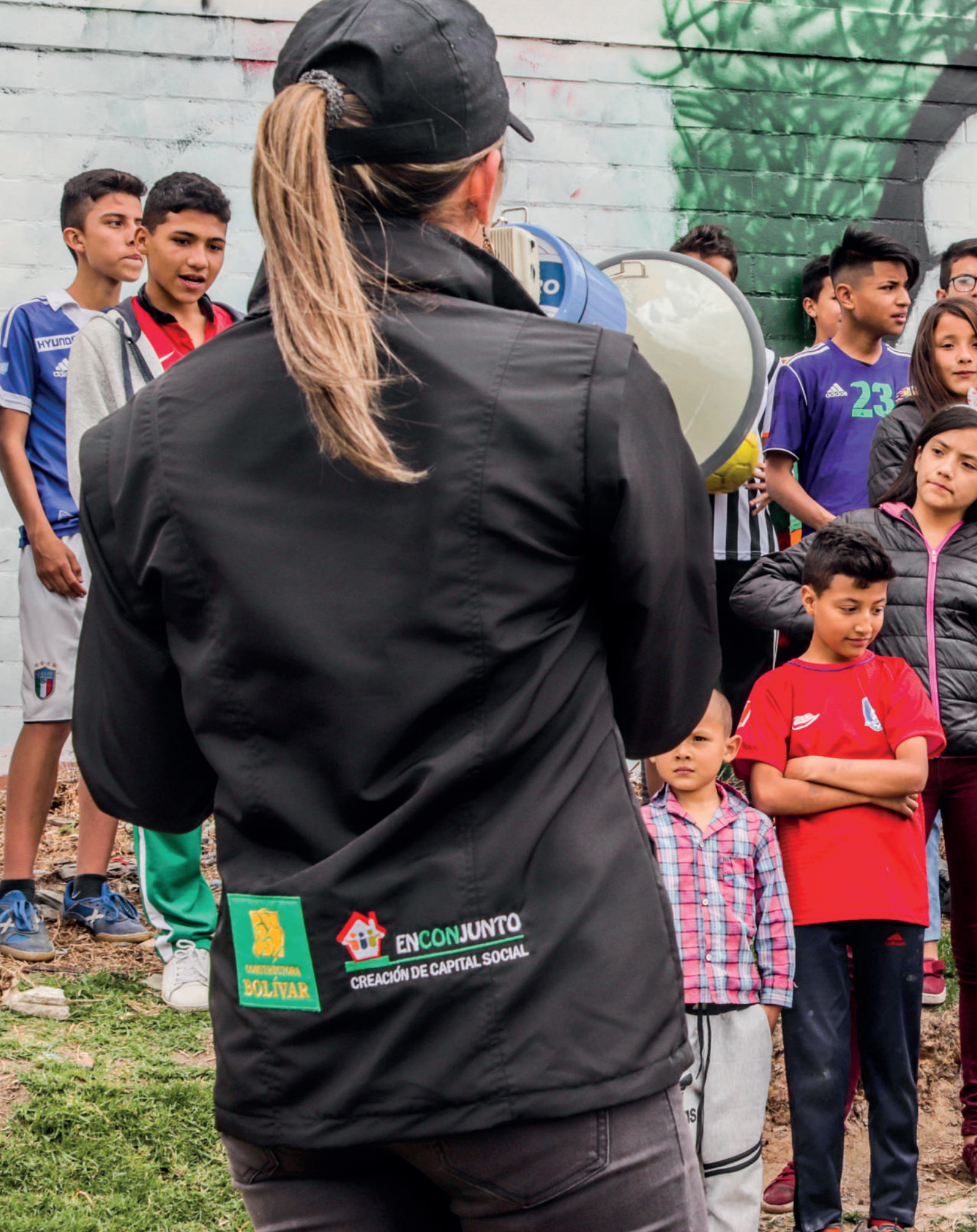
Inauguración ecoparque La Ronda en Parques del Tunal, Ciudad Bolívar.