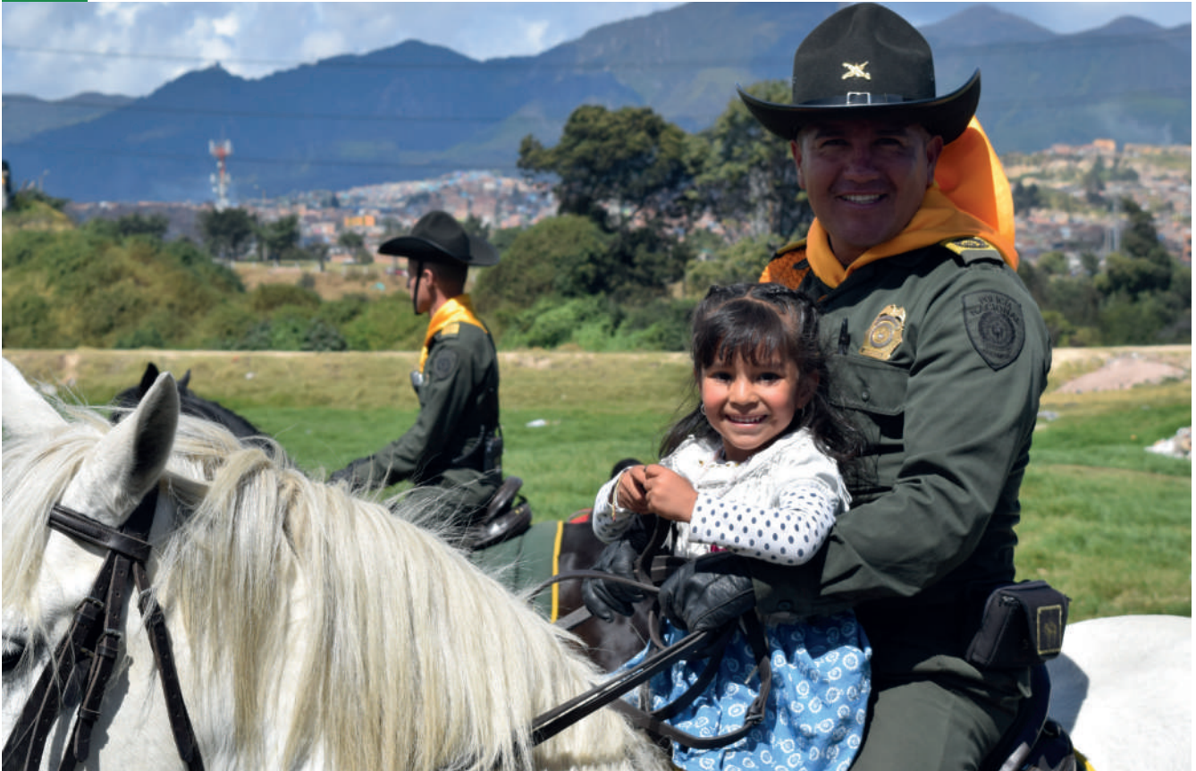
Inauguración ecoparque La Ronda en Parques del Tunal, Ciudad Bolívar.