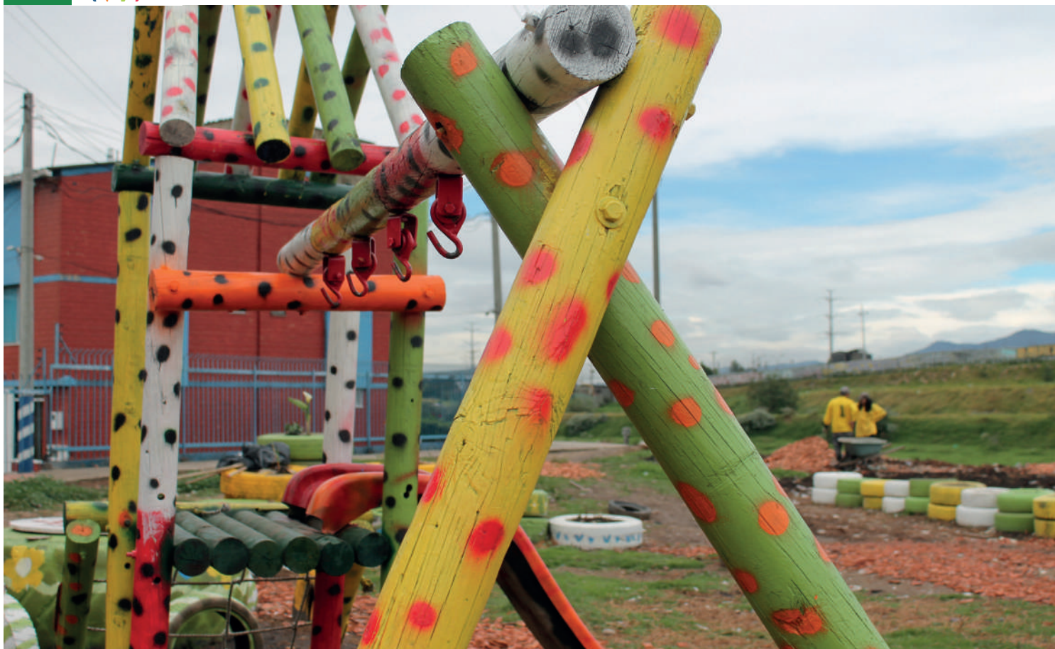
Construcción del ecoparque La Ronda en Parques del Tunal, Ciudad Bolívar.