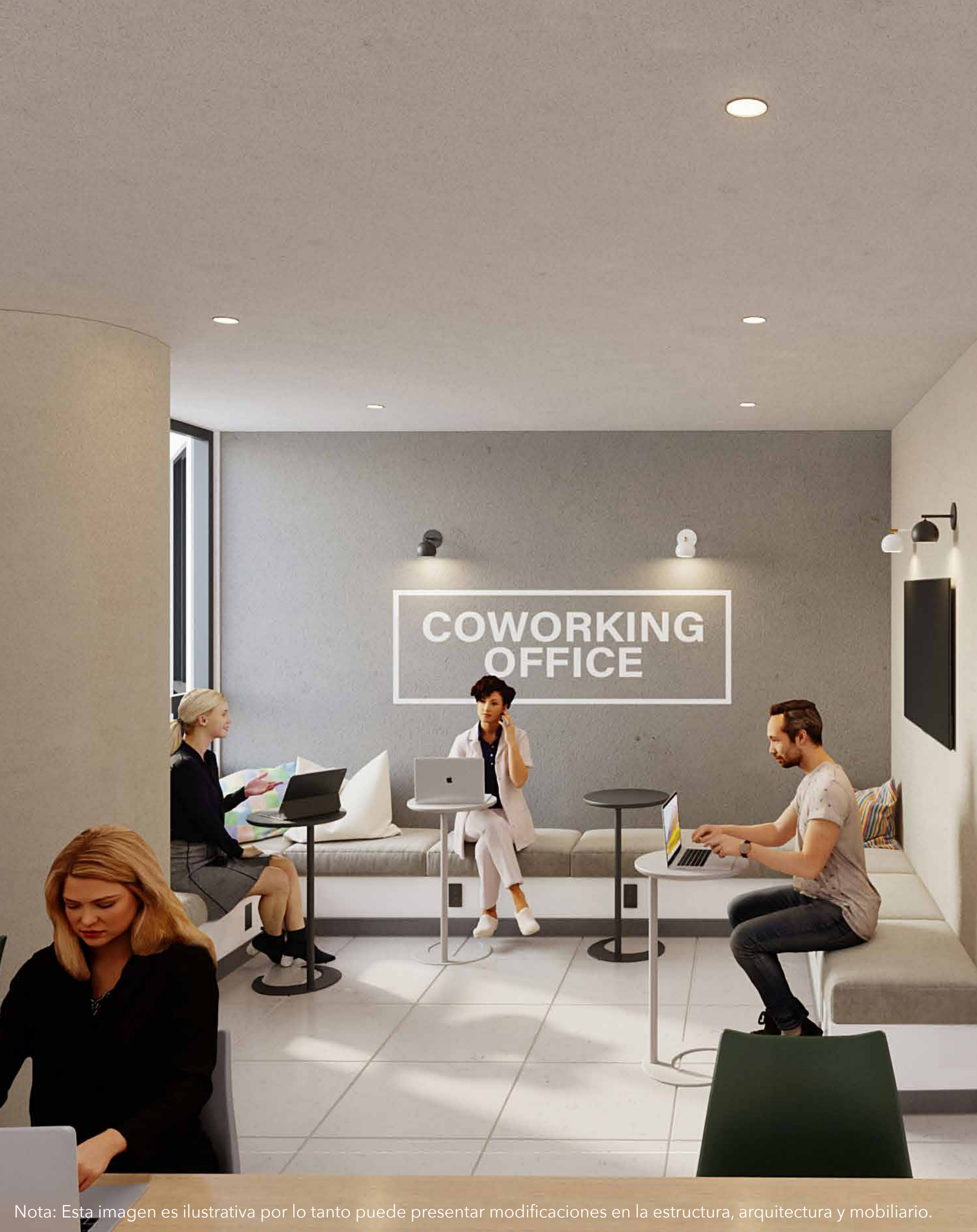
Nota: Esta imagen es ilustrativa por lo tanto puede presentar modificaciones en la estructura, arquitectura y mobiliario.