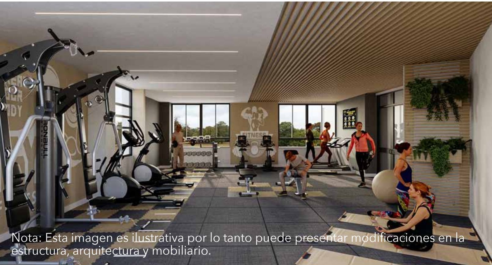
Nota: Esta imagen es ilustrativa por lo tanto puede presentar modificaciones en la estructura, arquitectura y mobiliario.