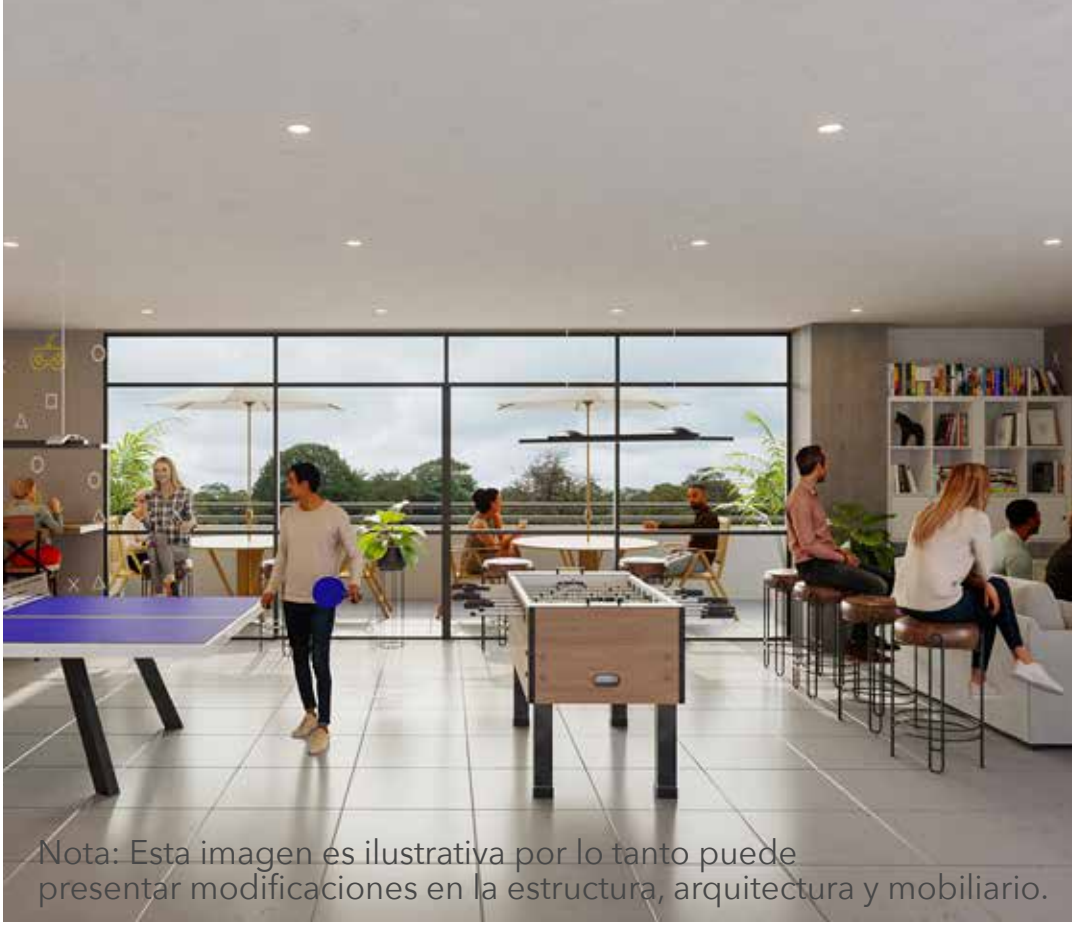
Nota: Esta imagen es ilustrativa por lo tanto puede presentar modificaciones en la estructura, arquitectura y mobiliario.