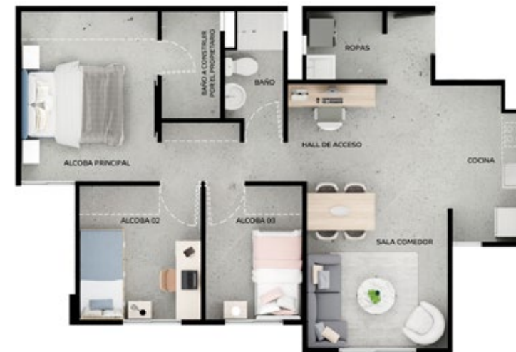
ASÍ LO PUEDES DEJAR