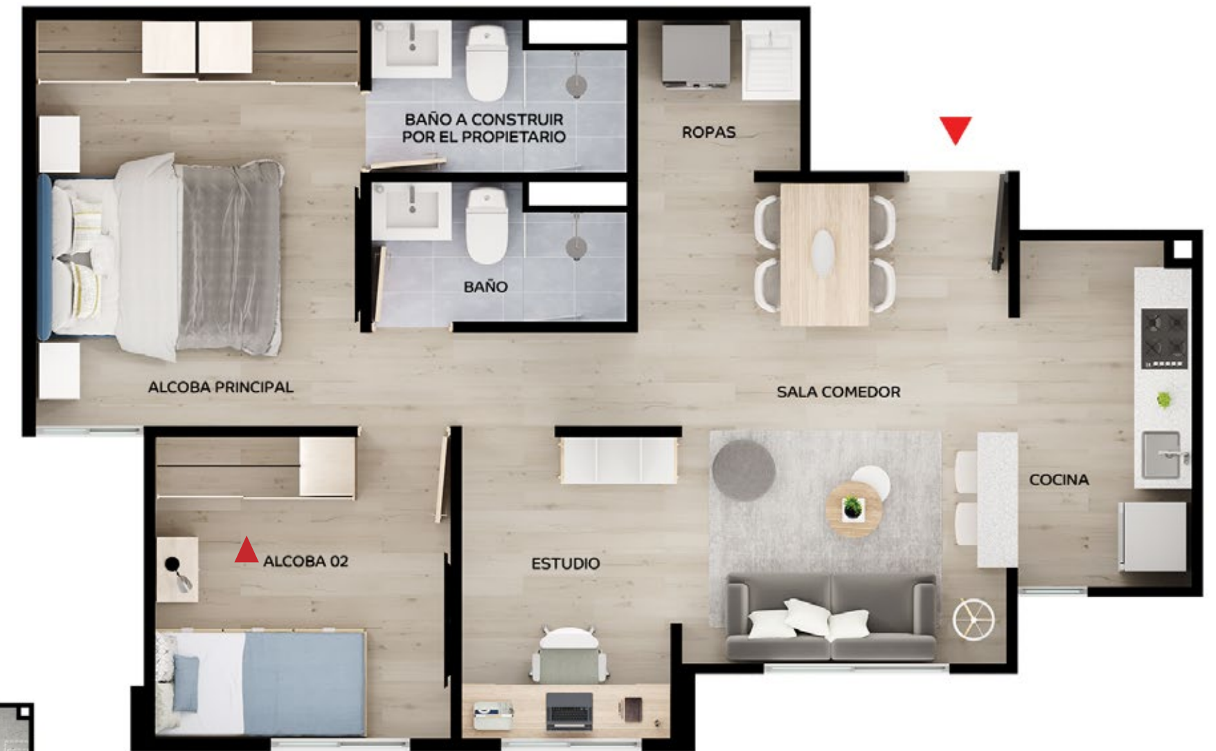
ASÍ LO PUEDES DEJAR