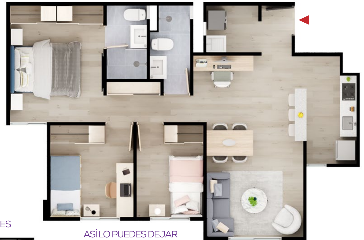
ASÍ LO RECIBES