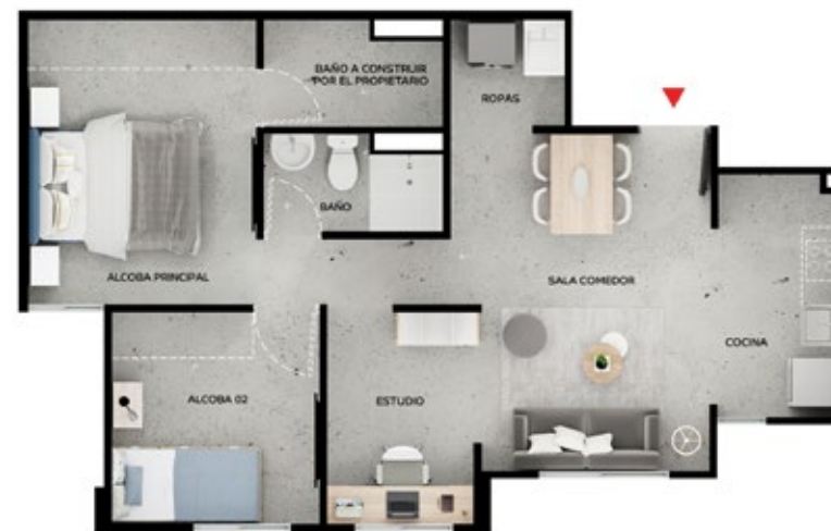
ASÍ LO RECIBES