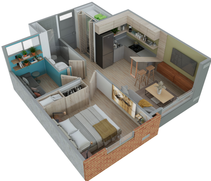
ASÍ LO PUEDES REMODELAR