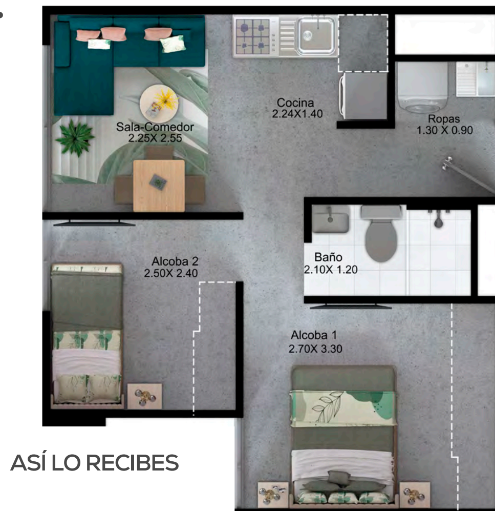
ASÍ LO RECIBES