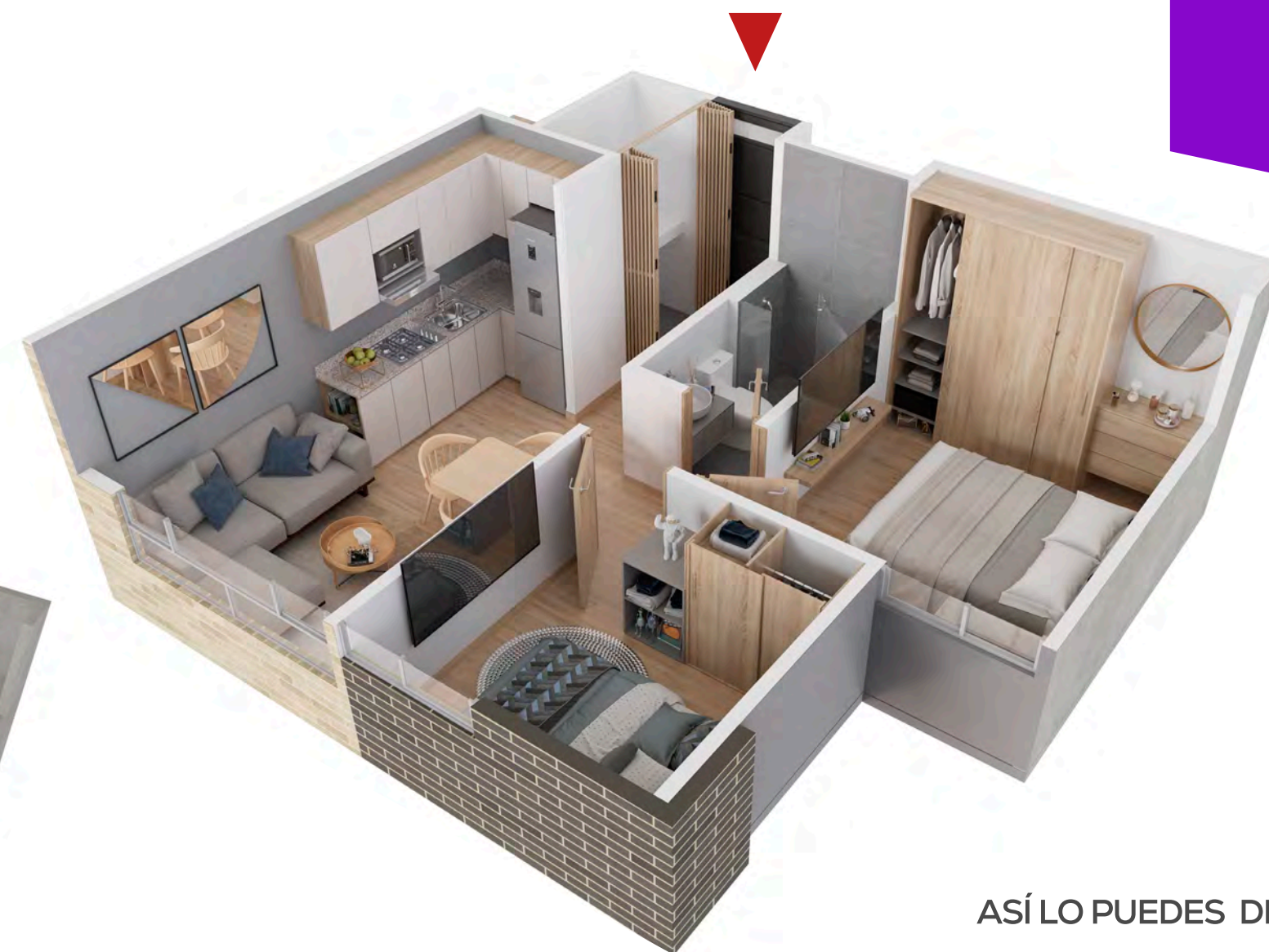
ASÍ LO PUEDES DEJAR