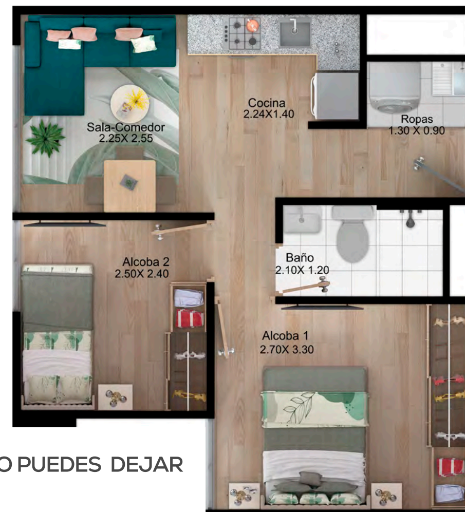
ASÍ LO PUEDES DEJAR