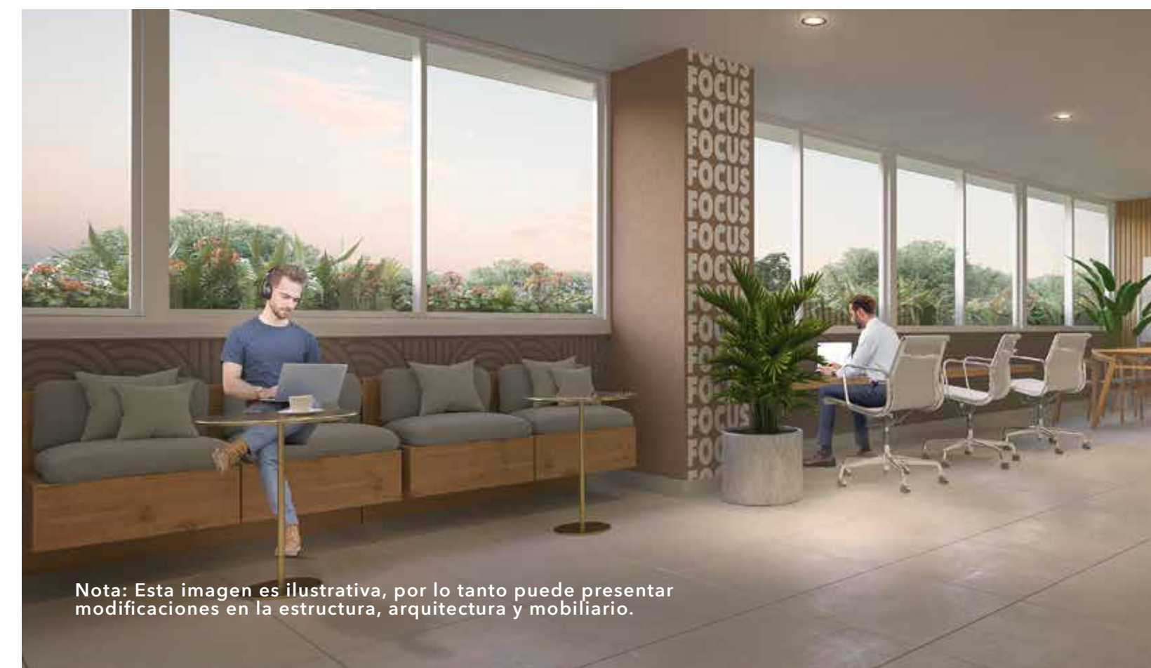
Nota: Esta imagen es ilustrativa, por lo tanto puede presentar modificaciones en la estructura, arquitectura y mobiliario.