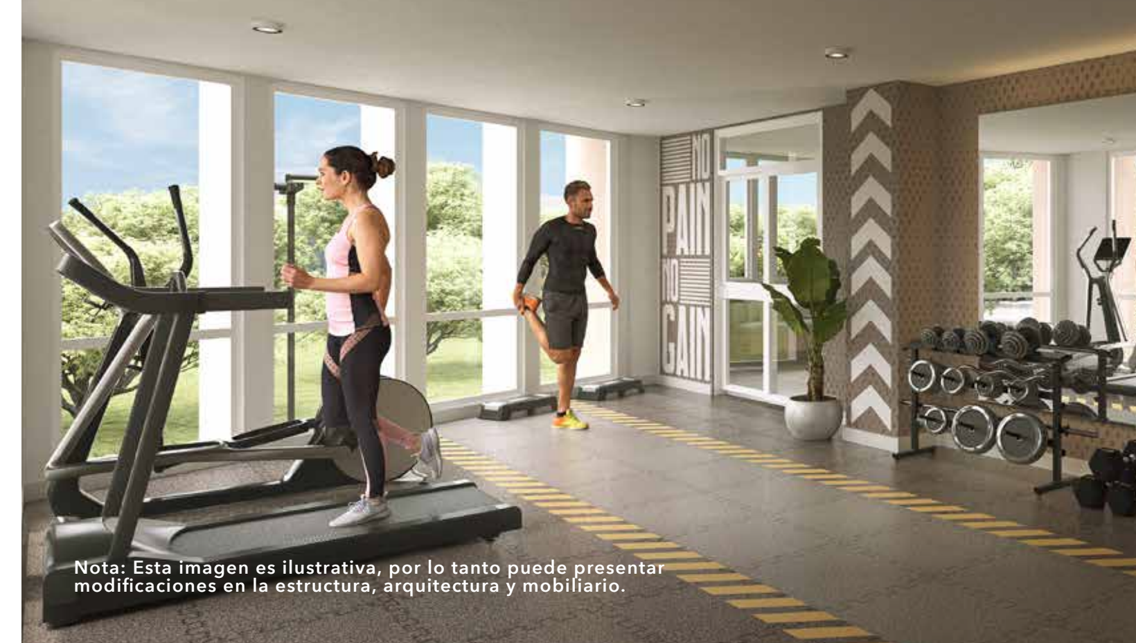
Nota: Esta imagen es ilustrativa, por lo tanto puede presentar modificaciones en la estructura, arquitectura y mobiliario.