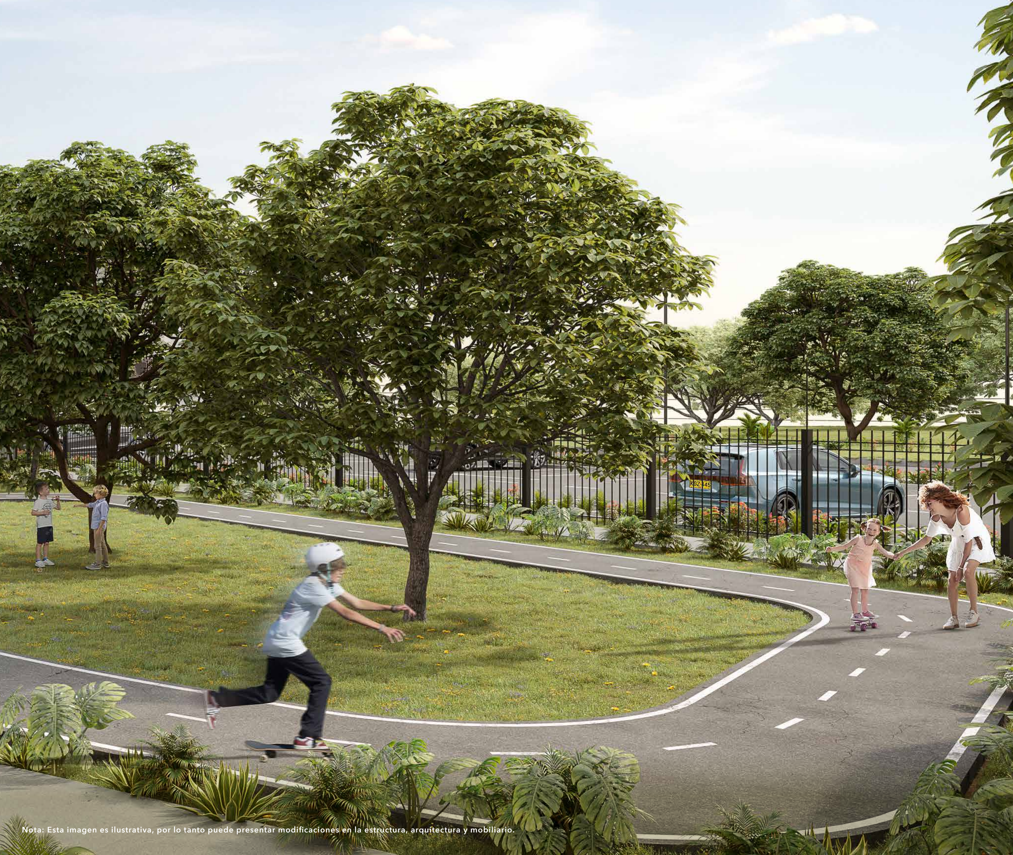
Nota: Esta imagen es ilustrativa, por lo tanto puede presentar modificaciones en la estructura, arquitectura y mobiliario.