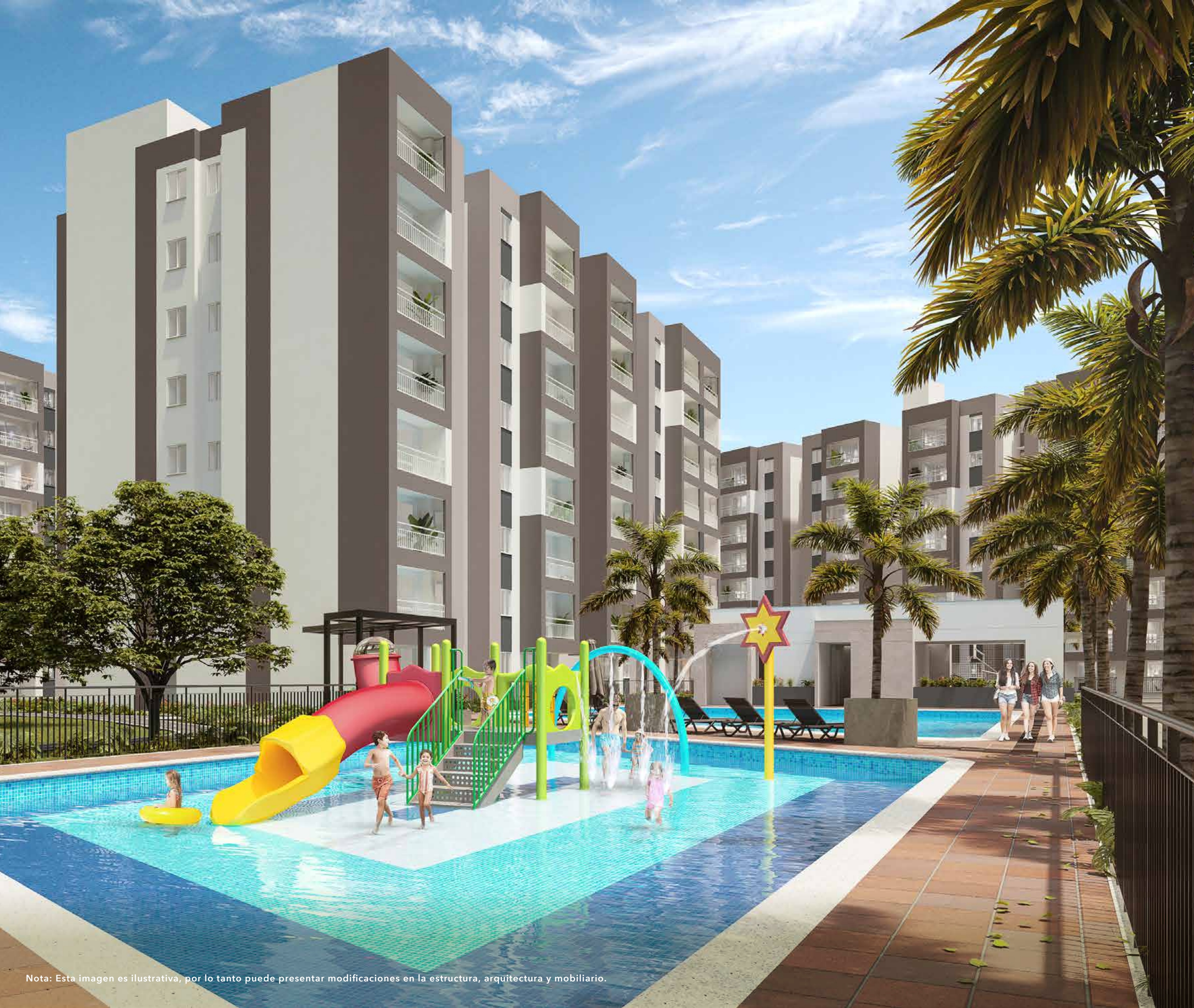
Nota: Esta imagen es ilustrativa, por lo tanto puede presentar modificaciones en la estructura, arquitectura y mobiliario.