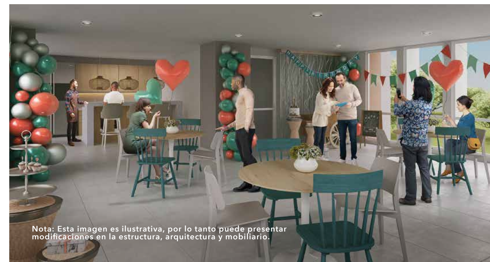
Nota: Esta imagen es ilustrativa, por lo tanto puede presentar modificaciones en la estructura, arquitectura y mobiliario.