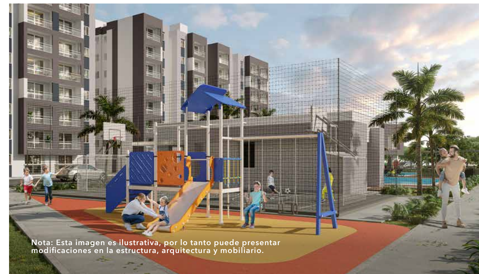
Nota: Esta imagen es ilustrativa, por lo tanto puede presentar modificaciones en la estructura, arquitectura y mobiliario.