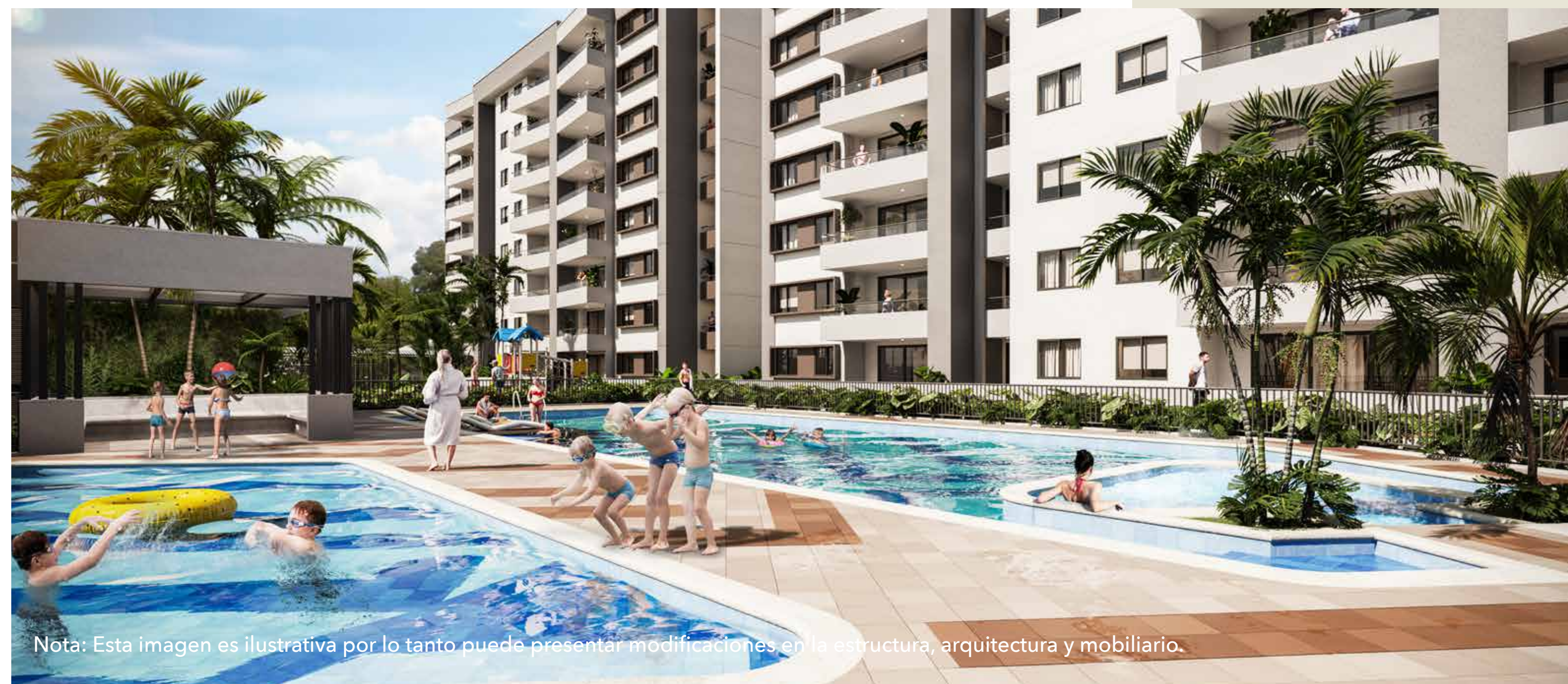
Nota: Esta imagen es ilustrativa por lo tanto puede presentar modificaciones en la estructura, arquitectura y mobiliario.