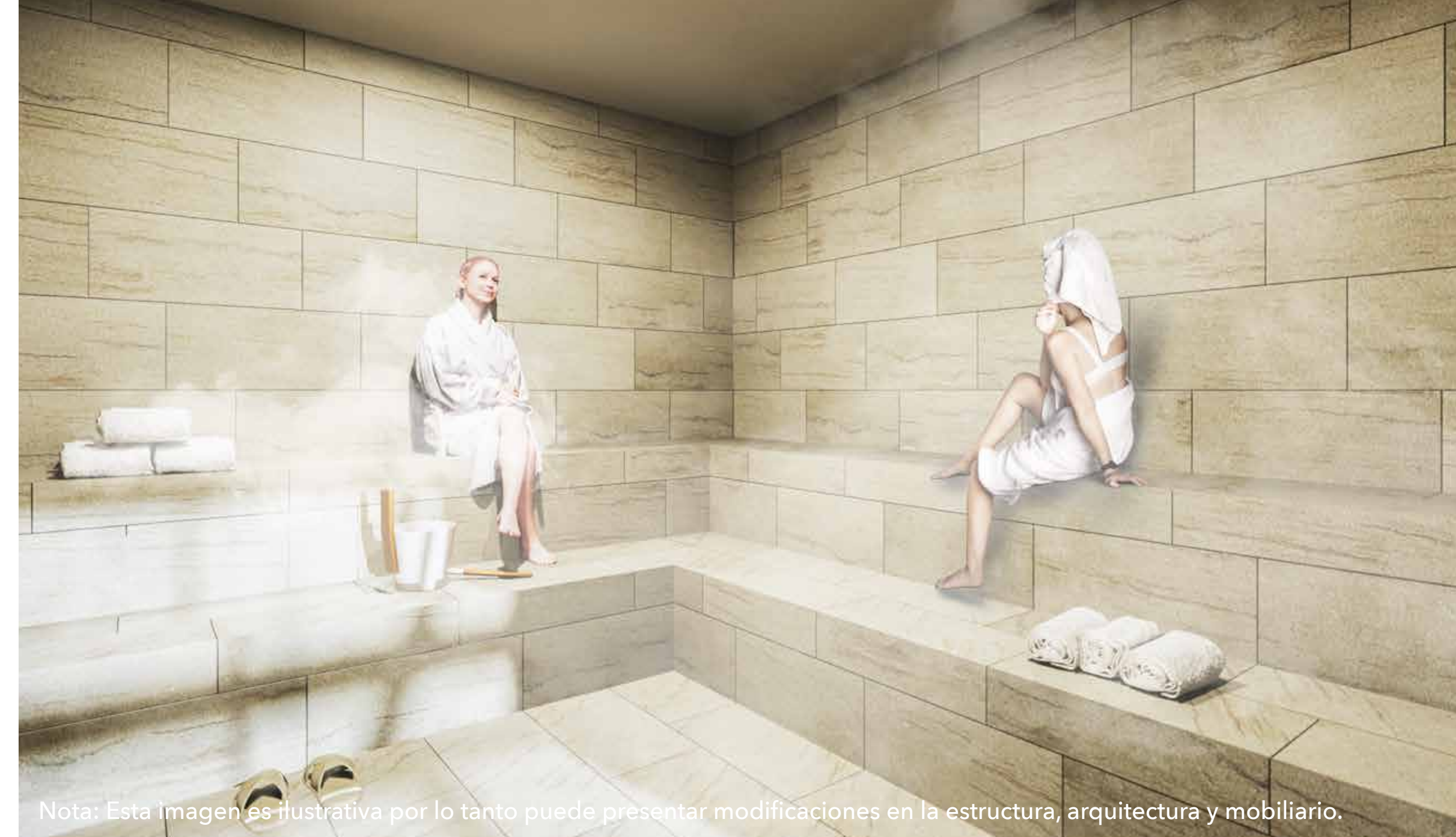
Nota: Esta imagen es ilustrativa por lo tanto puede presentar modificaciones en la estructura, arquitectura y mobiliario.