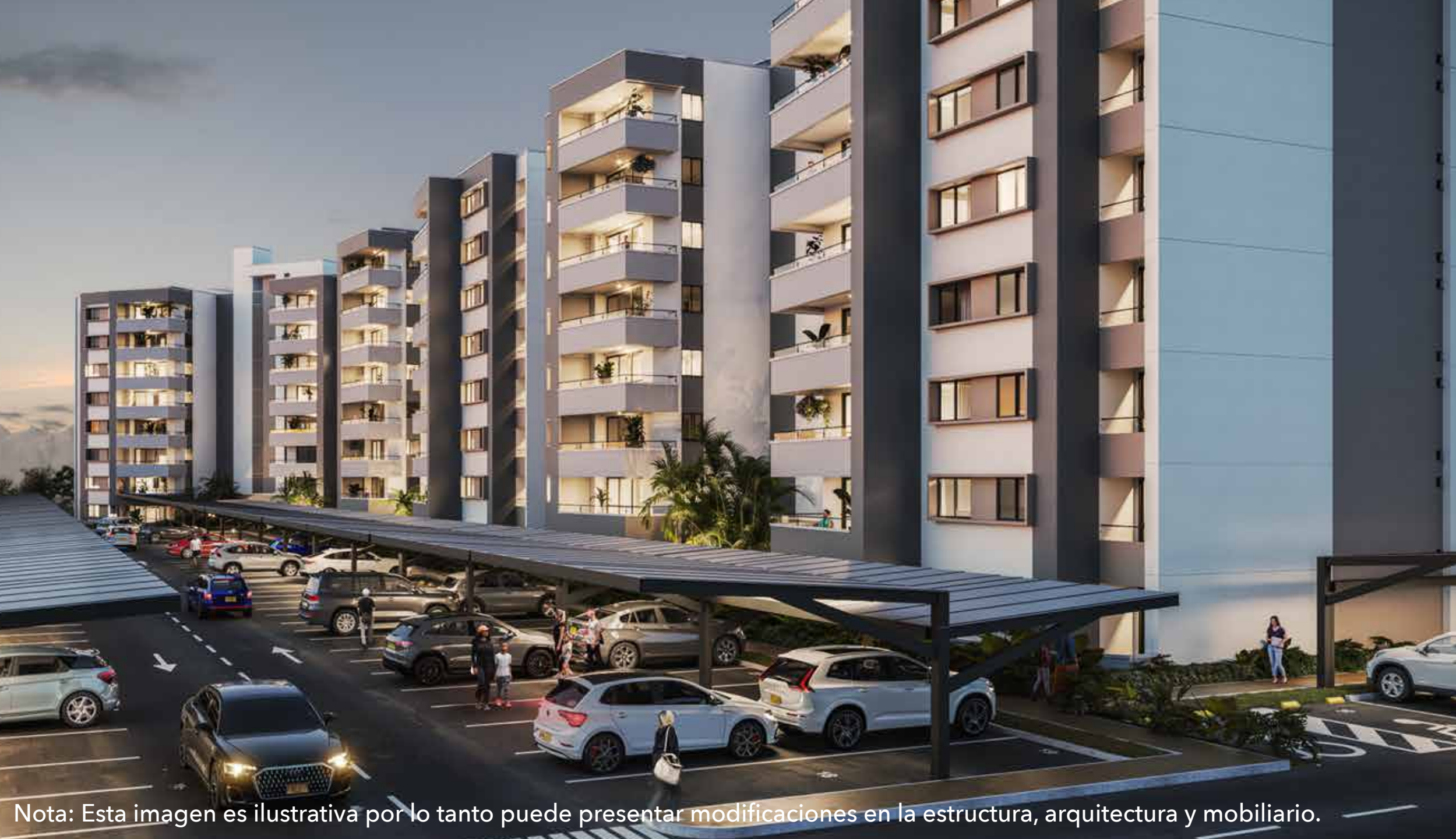
Nota: Esta imagen es ilustrativa por lo tanto puede presentar modificaciones en la estructura, arquitectura y mobiliario.