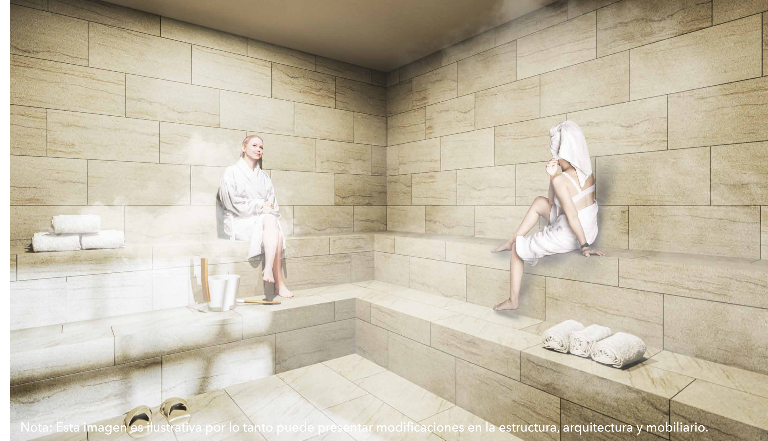
Nota: Esta imagen es ilustrativa por lo tanto puede presentar modificaciones en la estructura, arquitectura y mobiliario.