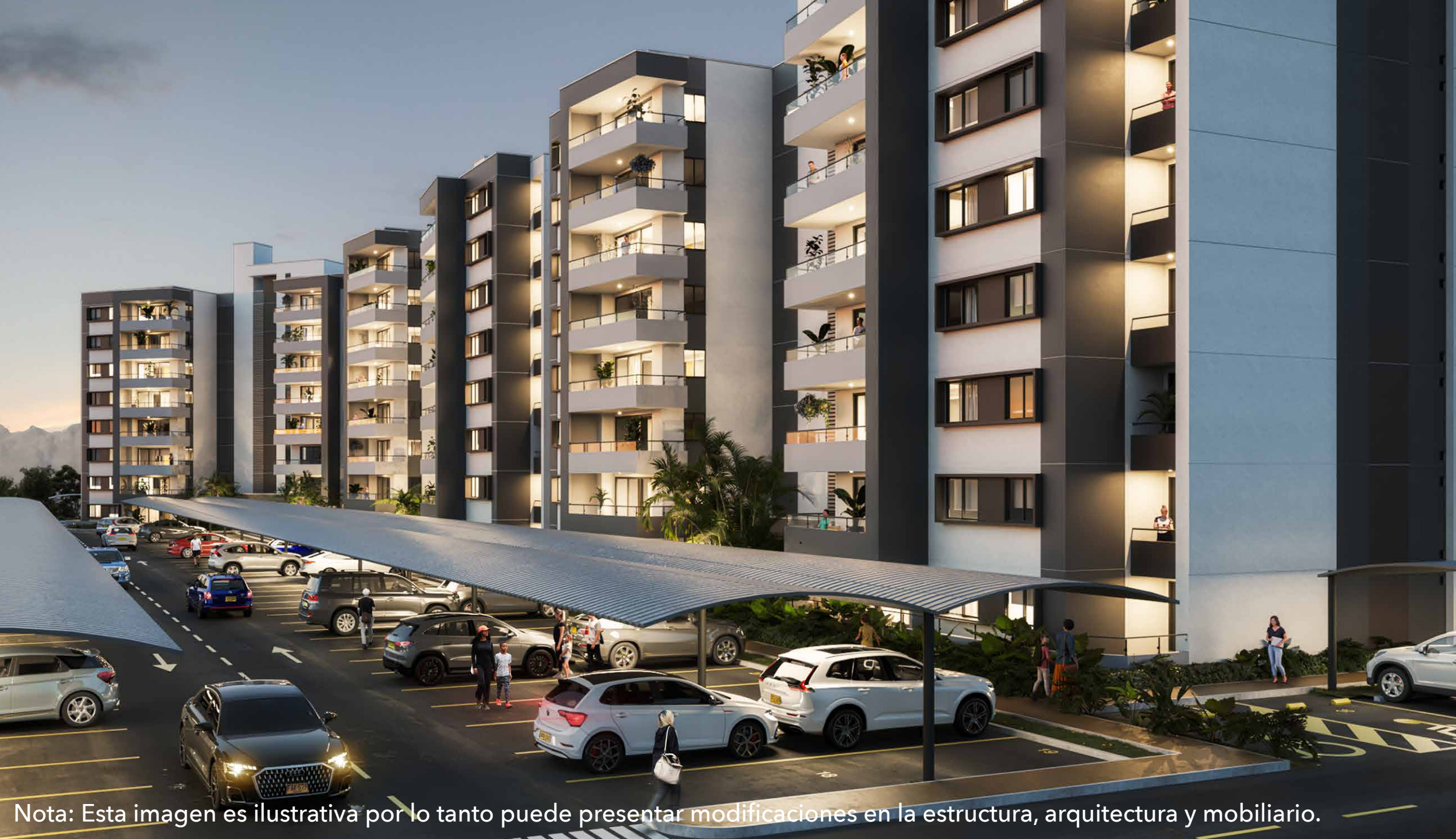
Nota: Esta imagen es ilustrativa por lo tanto puede presentar modificaciones en la estructura, arquitectura y mobiliario.