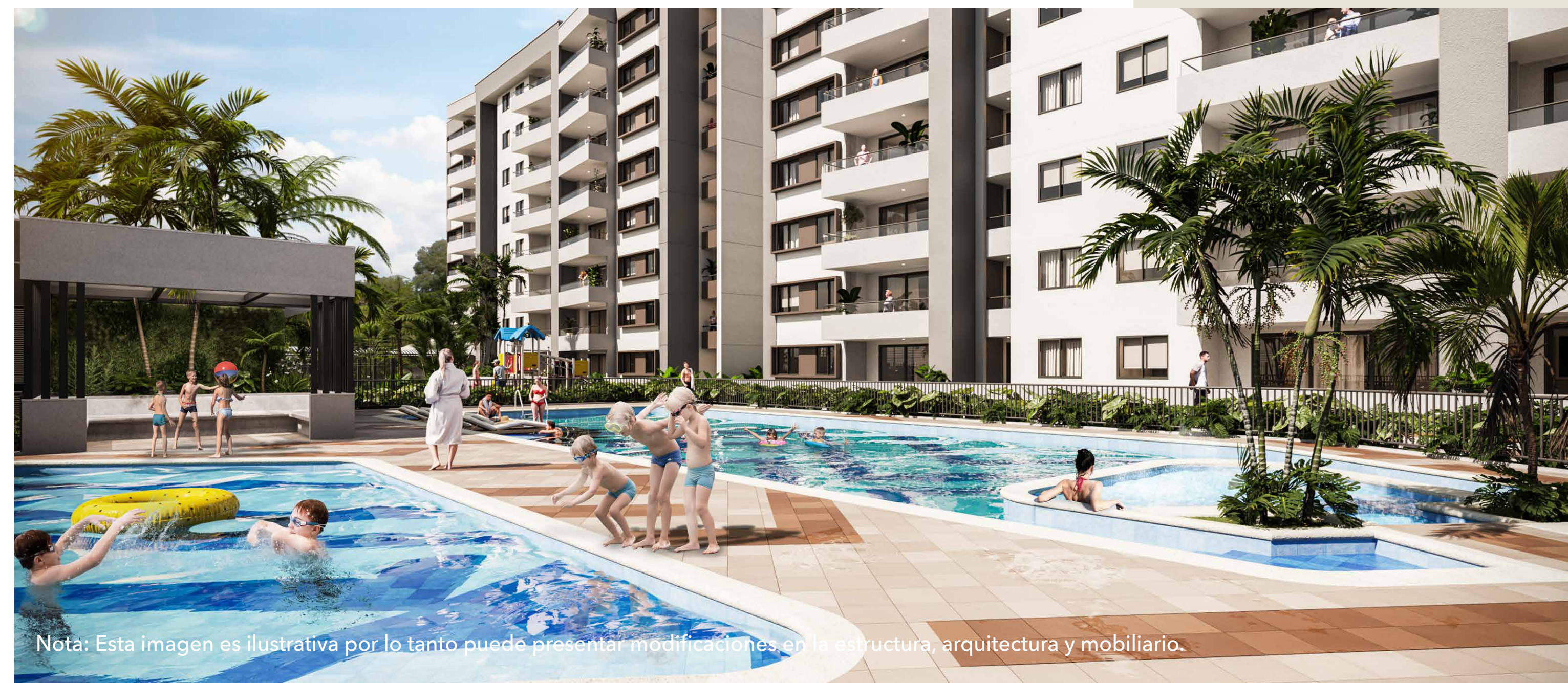
Nota: Esta imagen es ilustrativa por lo tanto puede presentar modificaciones en la estructura, arquitectura y mobiliario.