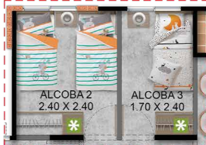
Opción Futuro Desarrollo - Vestier y Alcoba 2