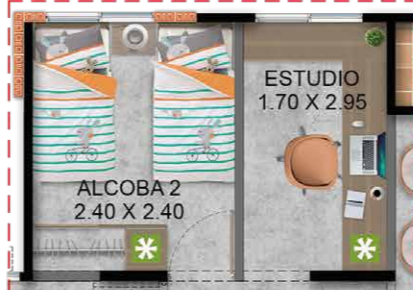
Opción Para Futuro Desarrollo- Alcoba 2 con Estudio