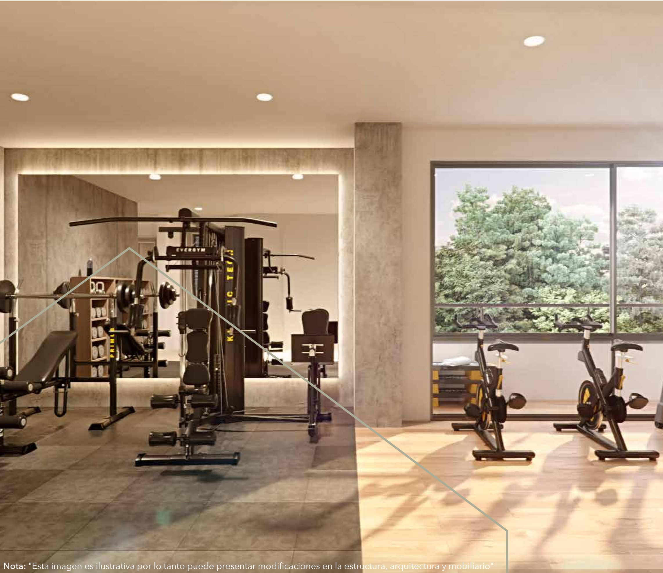
Nota: "Esta imagen es ilustrativa por lo tanto puede presentar modificaciones en la estructura, arquitectura y mobiliario"