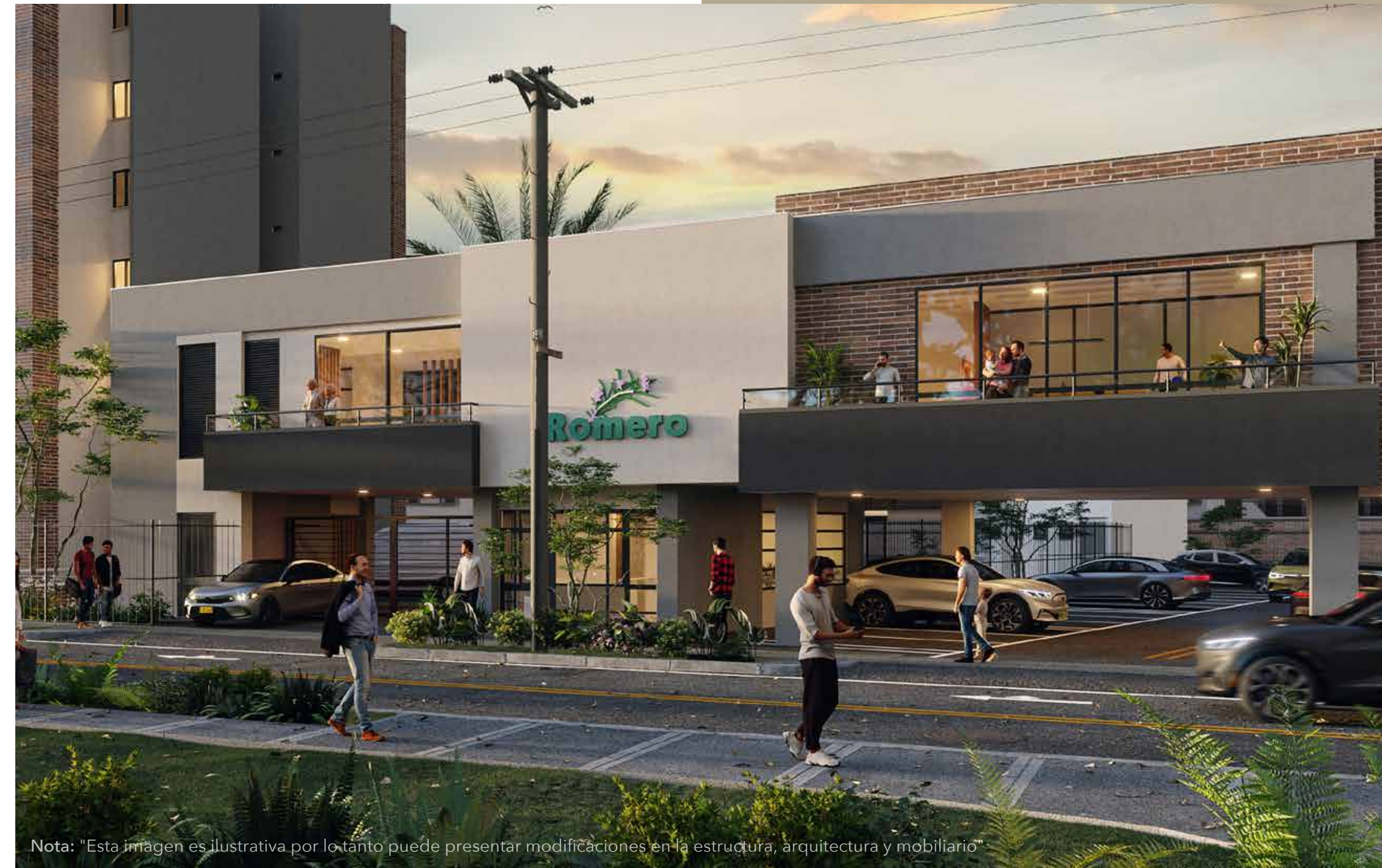
Nota: "Esta imagen es ilustrativa por lo tanto puede presentar modificaciones en la estructura, arquitectura y mobiliario"

AQUÍ COMIENZAN A MATERIALIZARSE TODOS | TUS SUEÑOS