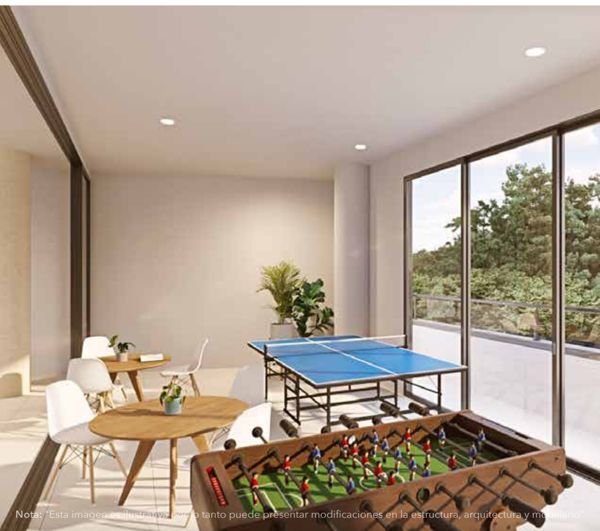
Nota: "Esta imagen es ilustrativa por lo tanto puede presentar modificaciones en la estructura, arquitectura y mobiliario"