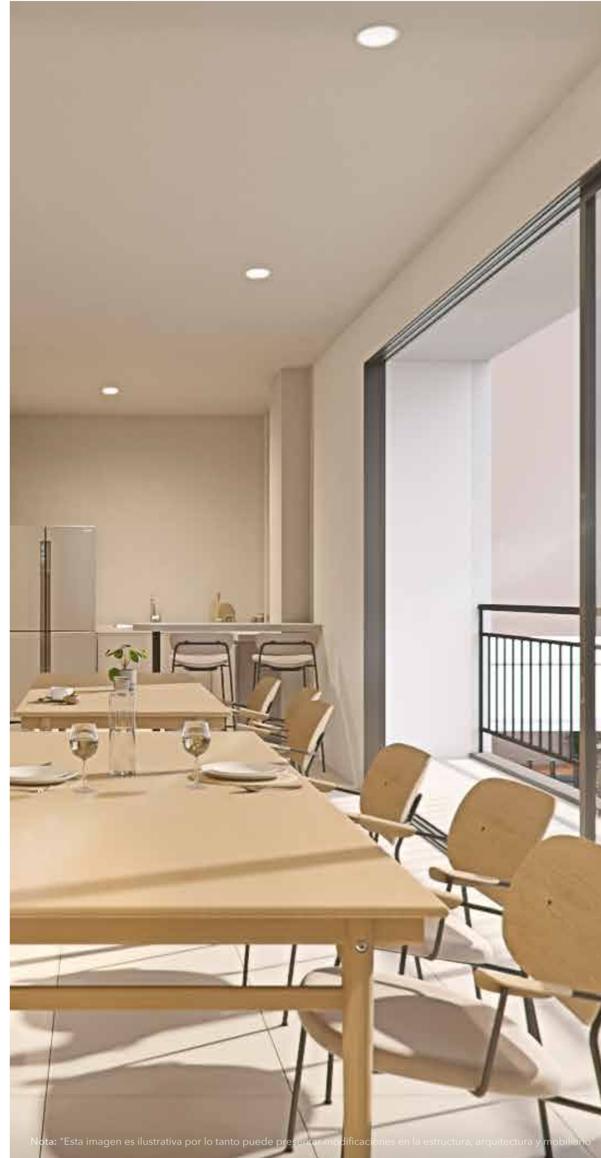
Nota: "Esta imagen es ilustrativa por lo tanto puede presentar modificaciones en la estructura, arquitectura y mobiliario"