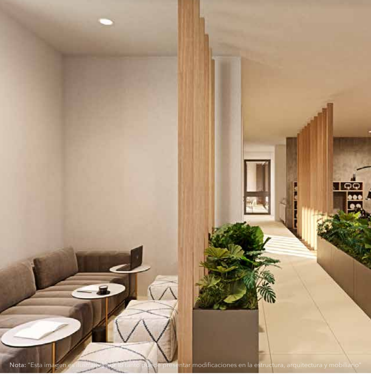
Nota: "Esta imagen es ilustrativa por lo tanto puede presentar modificaciones en la estructura, arquitectura y mobiliario"