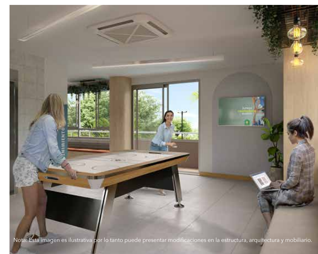
Nota: Esta imagen es ilustrativa por lo tanto puede presentar modificaciones en la estructura, arquitectura y mobiliario.