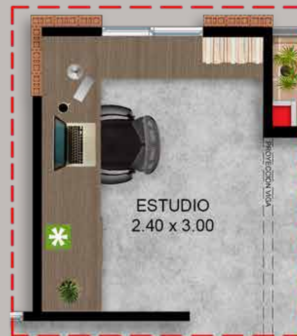
Opción para futuro desarrollo Estudio