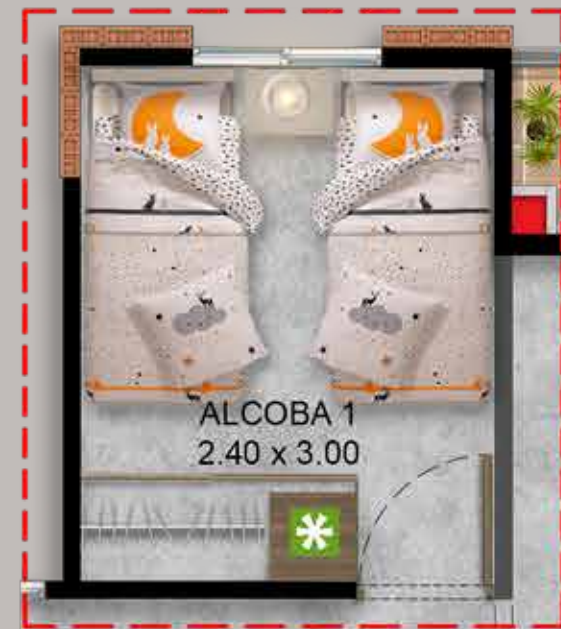
Opción para futuro desarrollo Alcoba 1