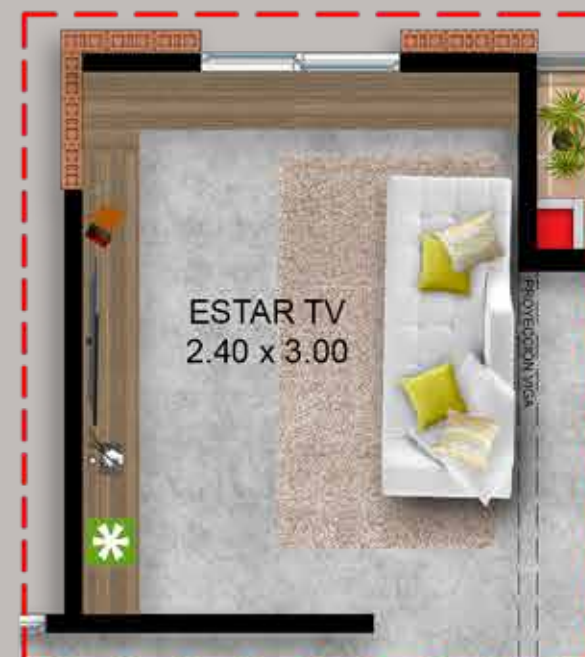
Opción para futuro desarrollo Estar TV