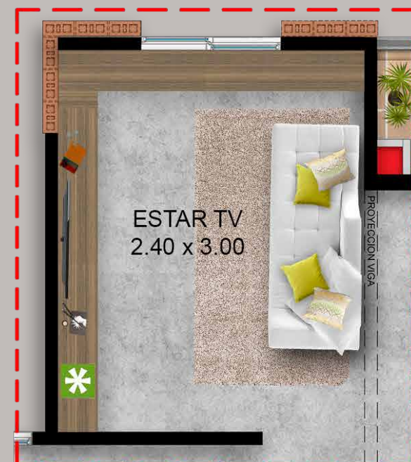
Opción para futuro desarrollo Estar TV