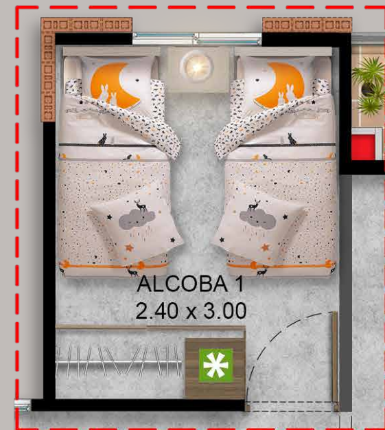
Opción para futuro desarrollo Alcoba 1