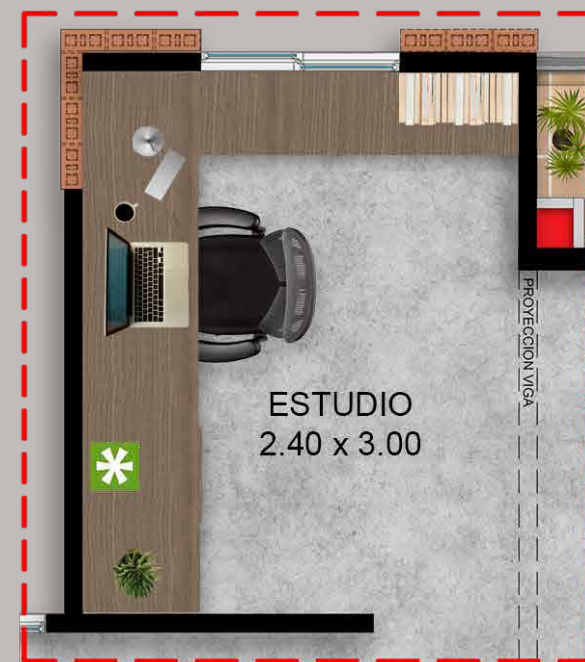
Opción para futuro desarrollo Estudio