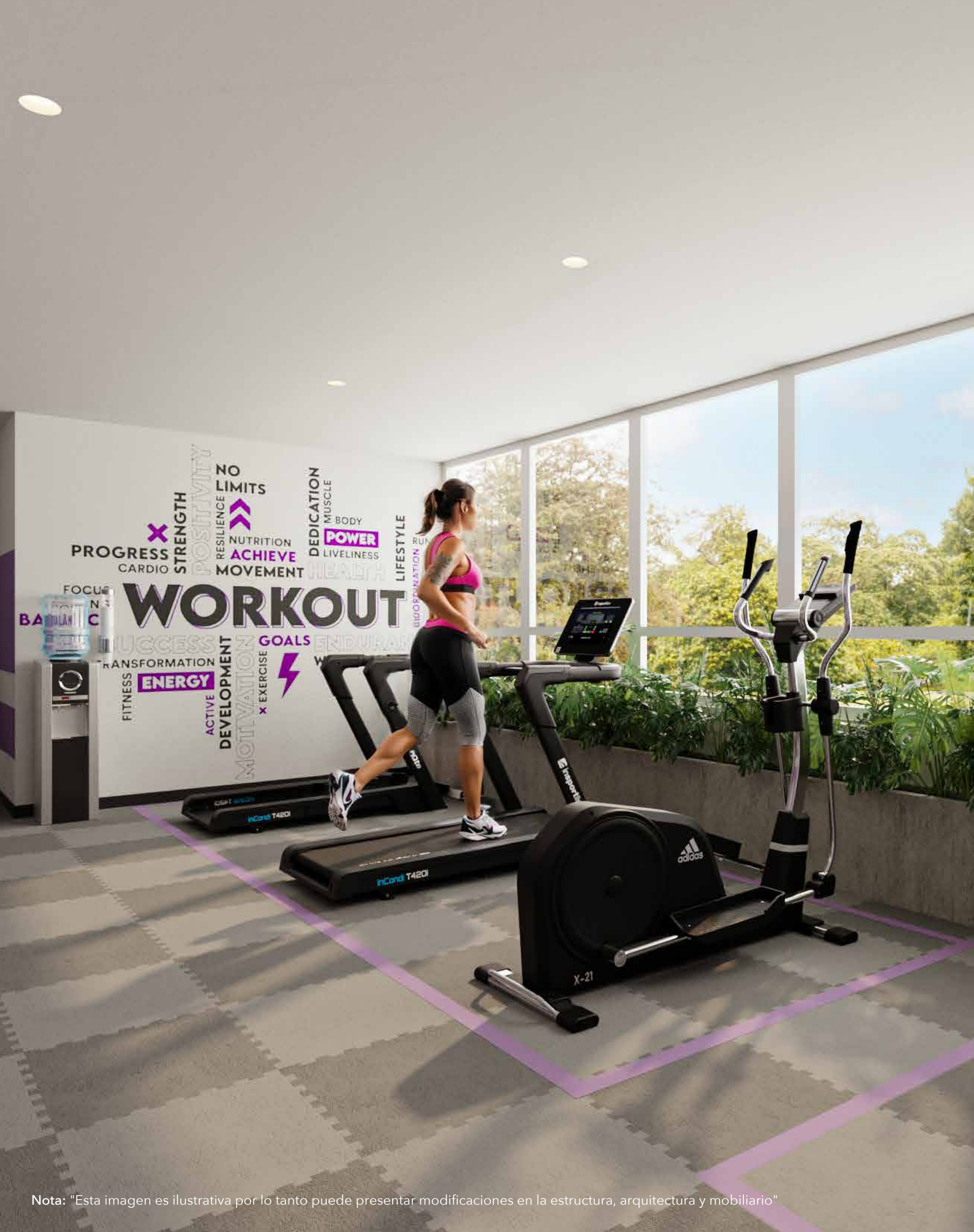
Nota: "Esta imagen es ilustrativa por lo tanto puede presentar modificaciones en la estructura, arquitectura y mobiliario"