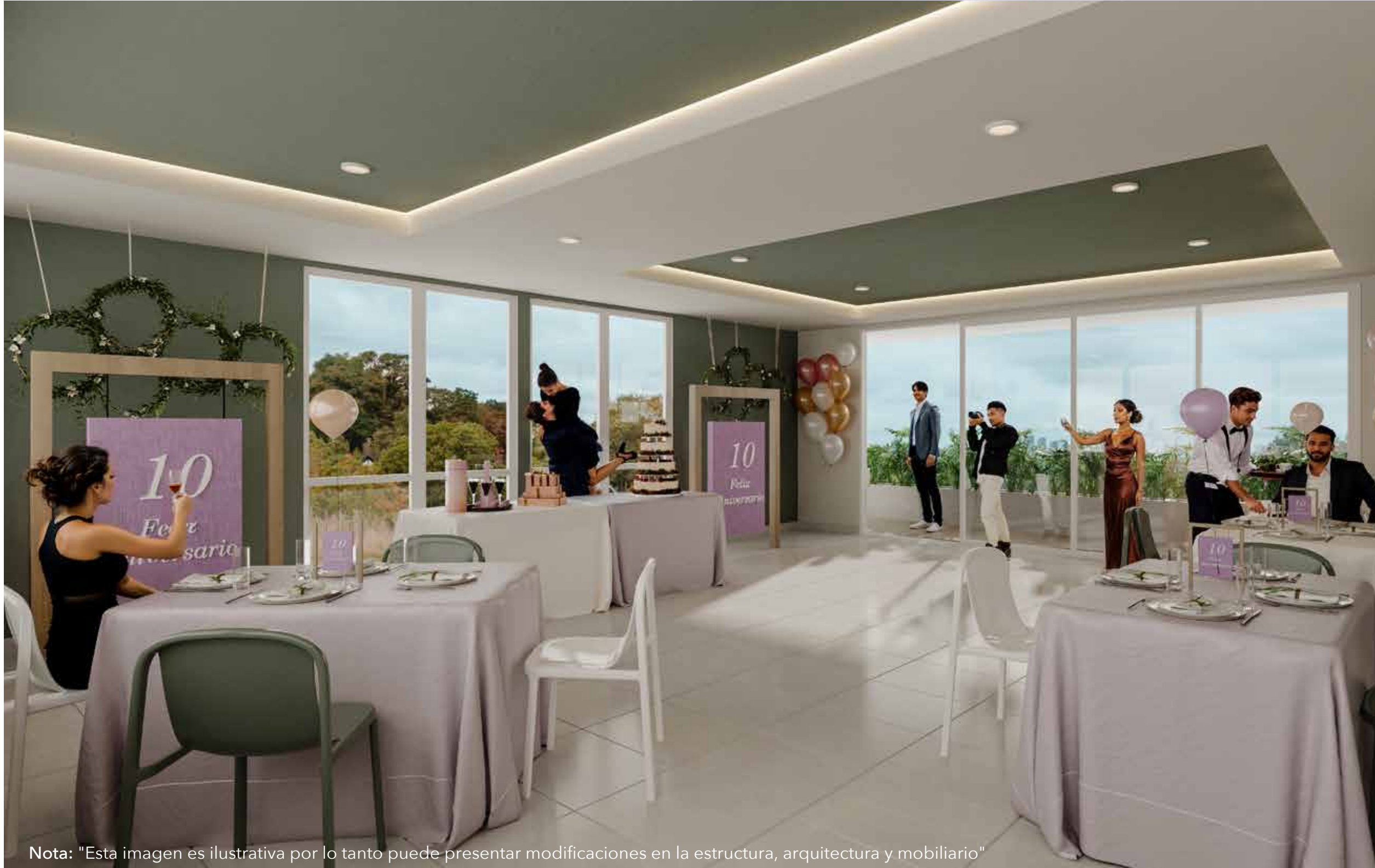
Nota: "Esta imagen es ilustrativa por lo tanto puede presentar modificaciones en la estructura, arquitectura y mobiliario"