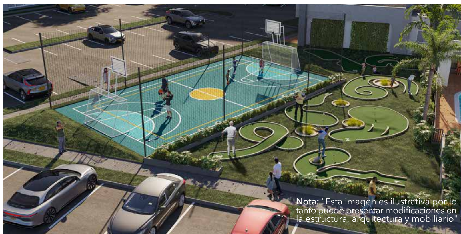
Nota: "Esta imagen es ilustrativa por lo tanto puede presentar modificaciones en la estructura, arquitectura y mobiliario"