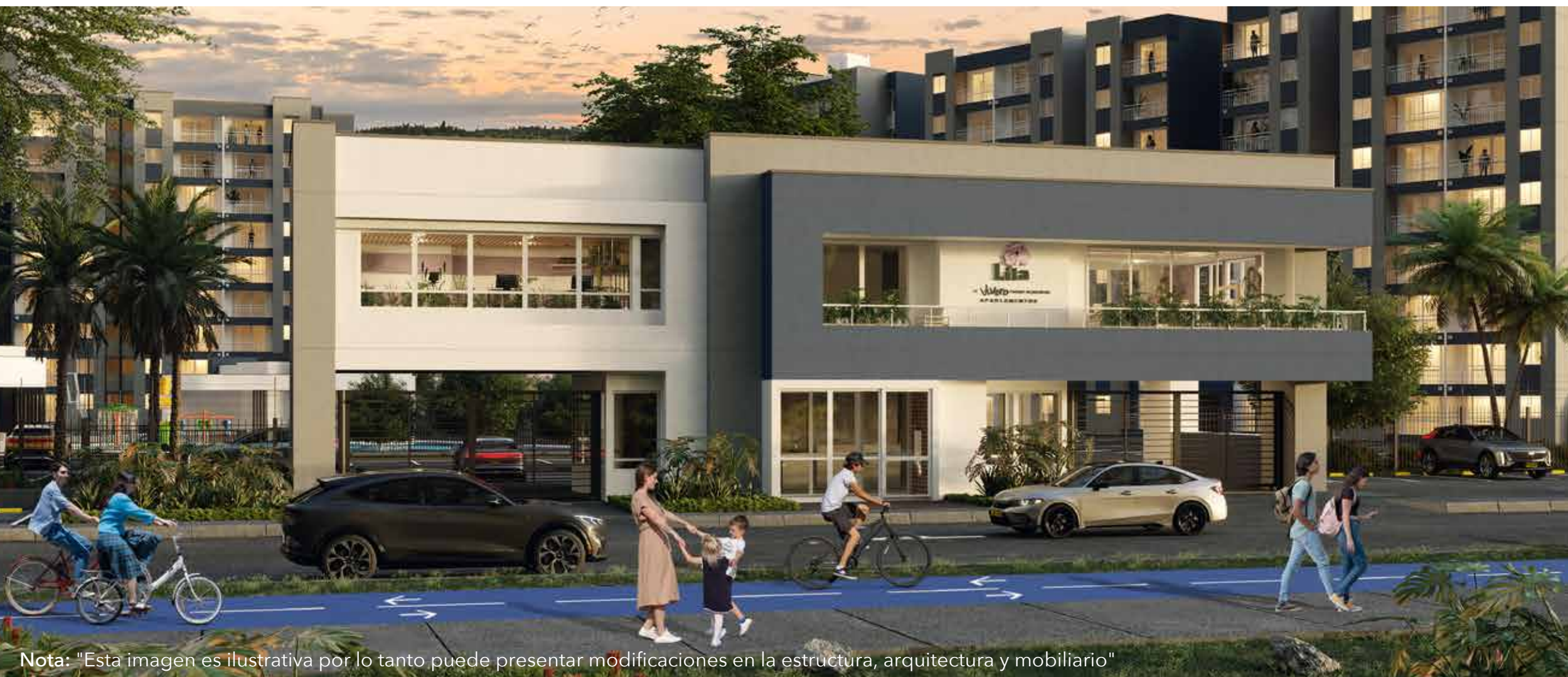
Nota: "Esta imagen es ilustrativa por lo tanto puede presentar modificaciones en la estructura, arquitectura y mobiliario"