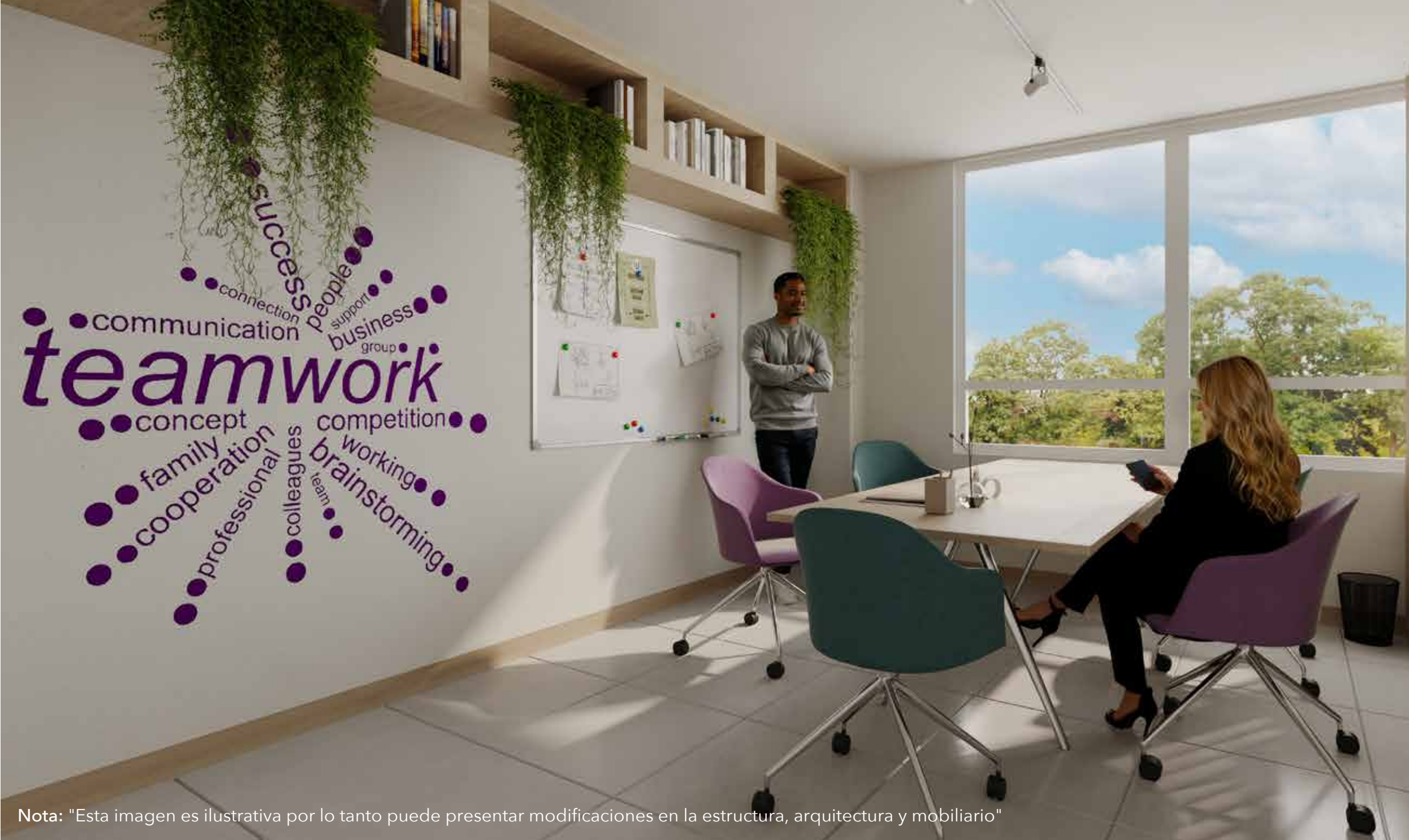
Nota: "Esta imagen es ilustrativa por lo tanto puede presentar modificaciones en la estructura, arquitectura y mobiliario"