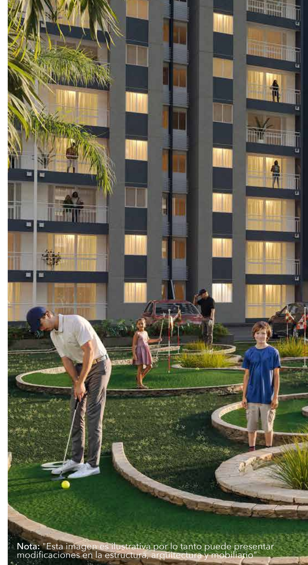
Nota: "Esta imagen es ilustrativa por lo tanto puede presentar modificaciones en la estructura, arquitectura y mobiliario"