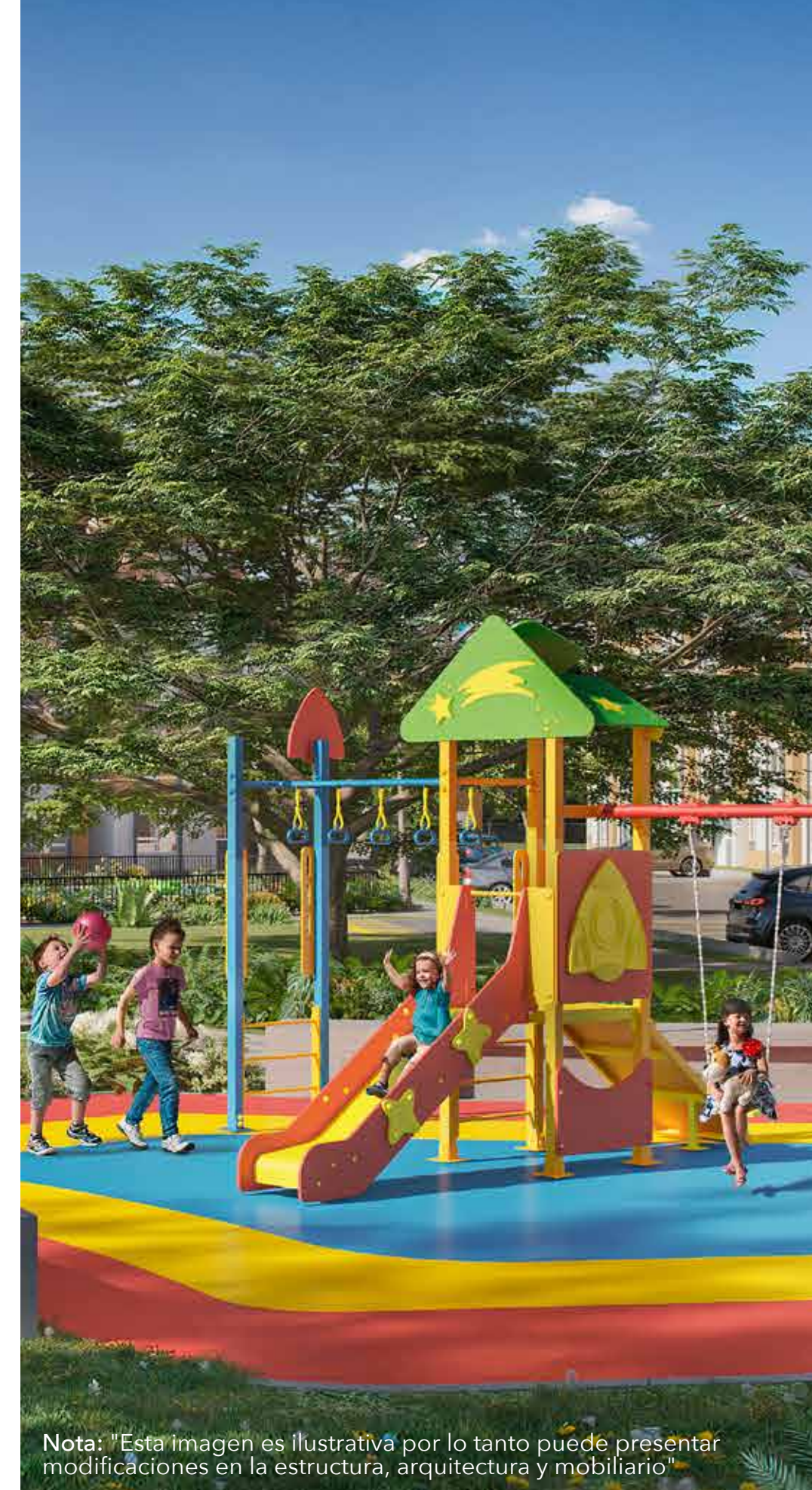
Nota: "Esta imagen es ilustrativa por lo tanto puede presentar modificaciones en la estructura, arquitectura y mobiliario"