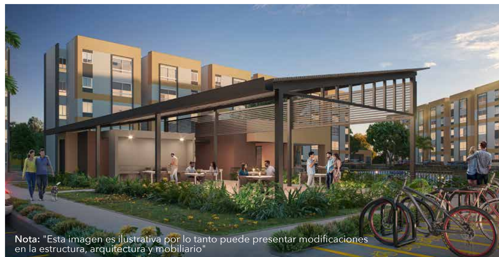
Nota: "Esta imagen es ilustrativa por lo tanto puede presentar modificaciones en la estructura, arquitectura y mobiliario"