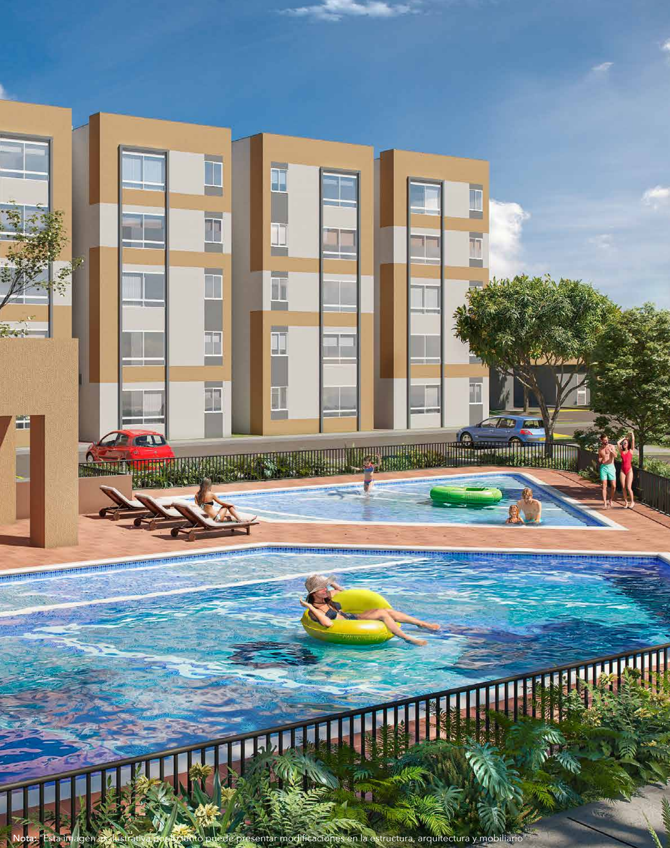
Nota: "Esta imagen es ilustrativa por lo tanto puede presentar modificaciones en la estructura, arquitectura y mobiliario"