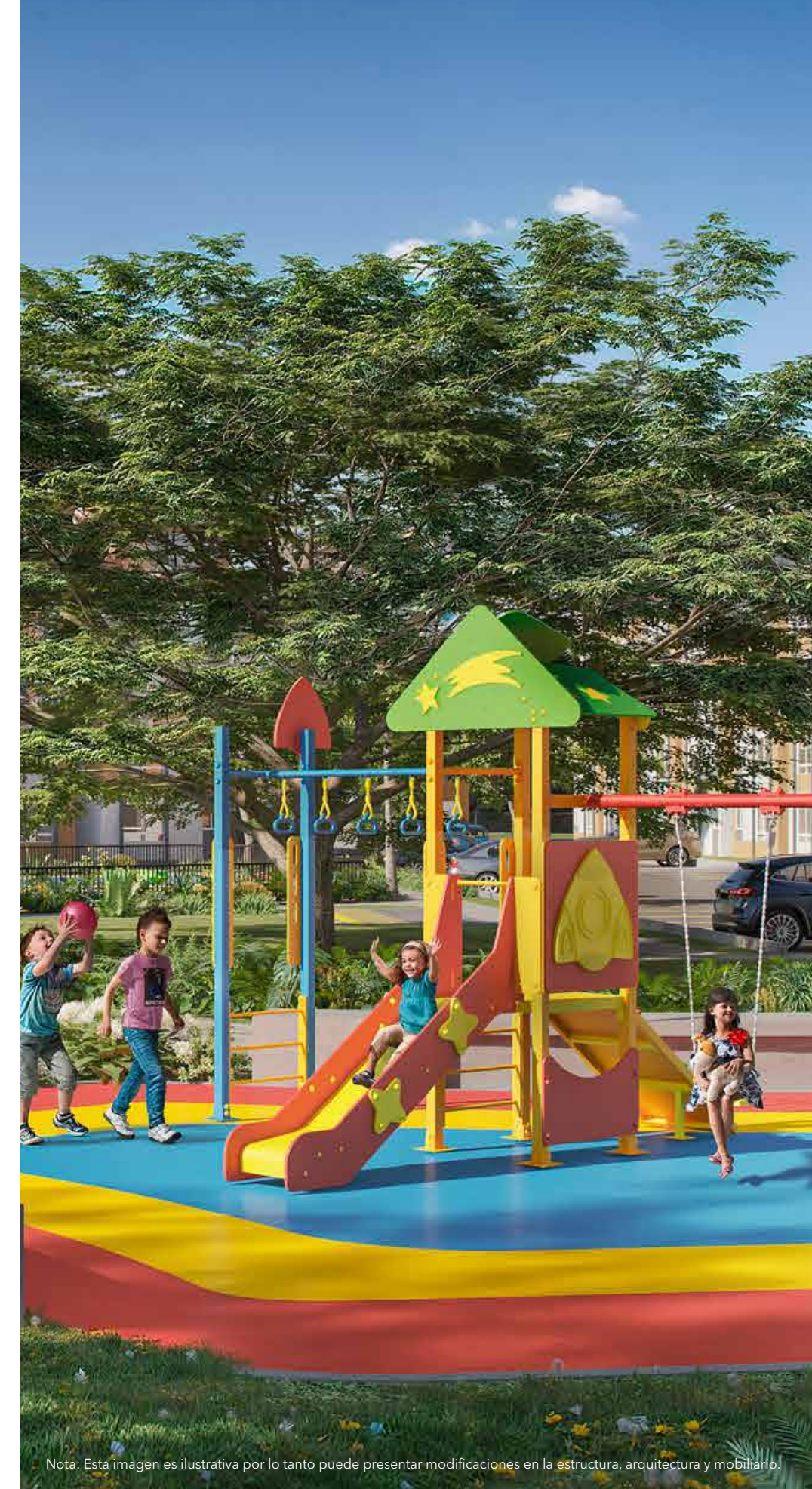
Nota: Esta imagen es ilustrativa por lo tanto puede presentar modificaciones en la estructura, arquitectura y mobiliario.