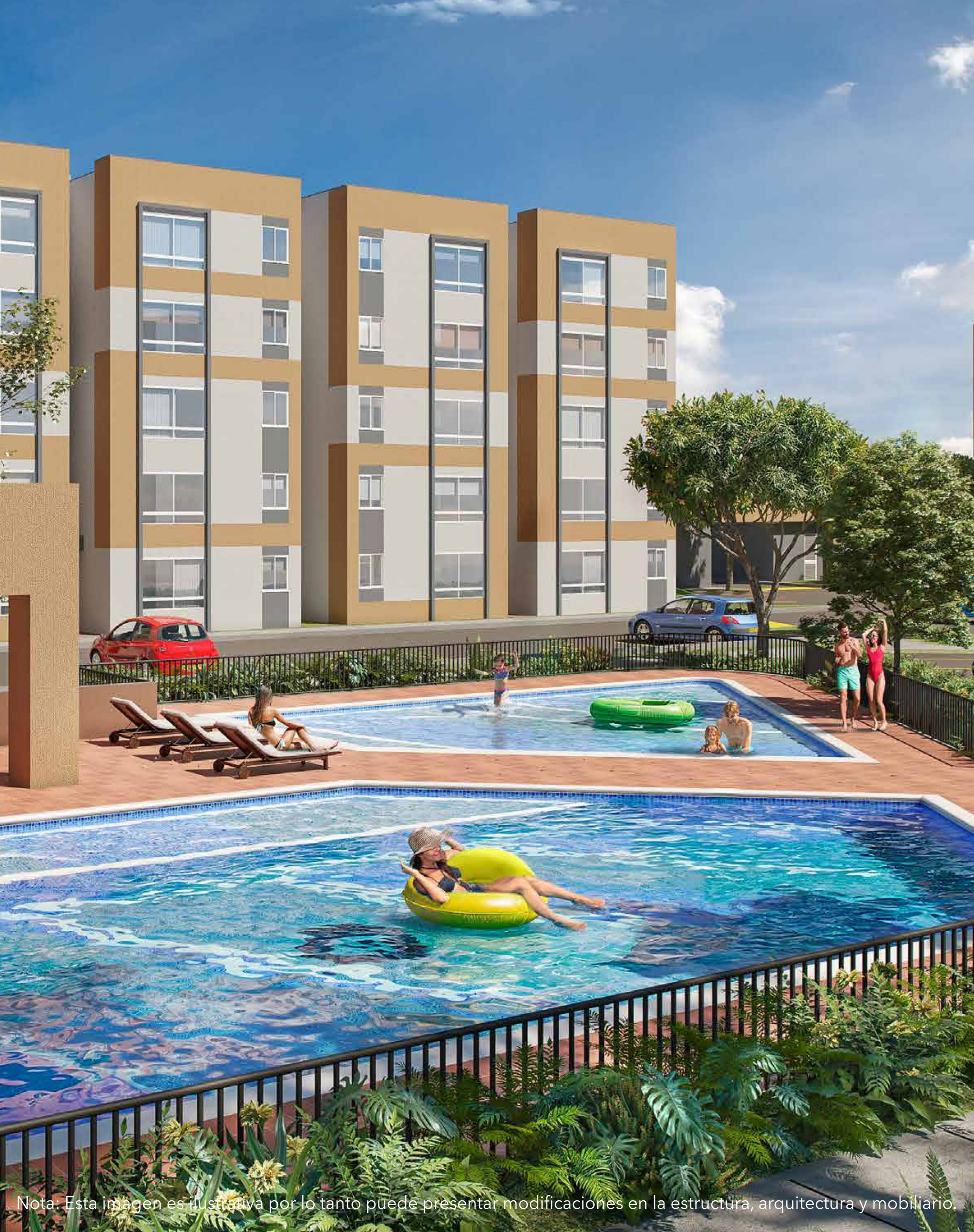
Nota: Esta imagen es ilustrativa por lo tanto puede presentar modificaciones en la estructura, arquitectura y mobiliario.