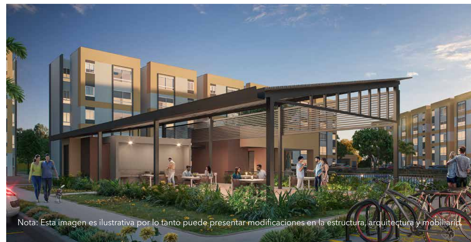
Nota: Esta imagen es ilustrativa por lo tanto puede presentar modificaciones en la estructura, arquitectura y mobiliario.