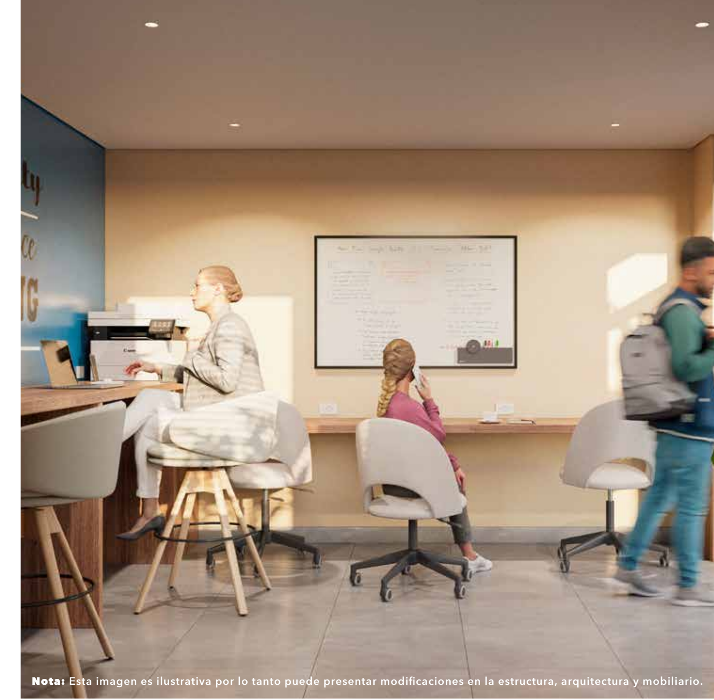
Nota: Esta imagen es ilustrativa por lo tanto puede presentar modificaciones en la estructura, arquitectura y mobiliario.