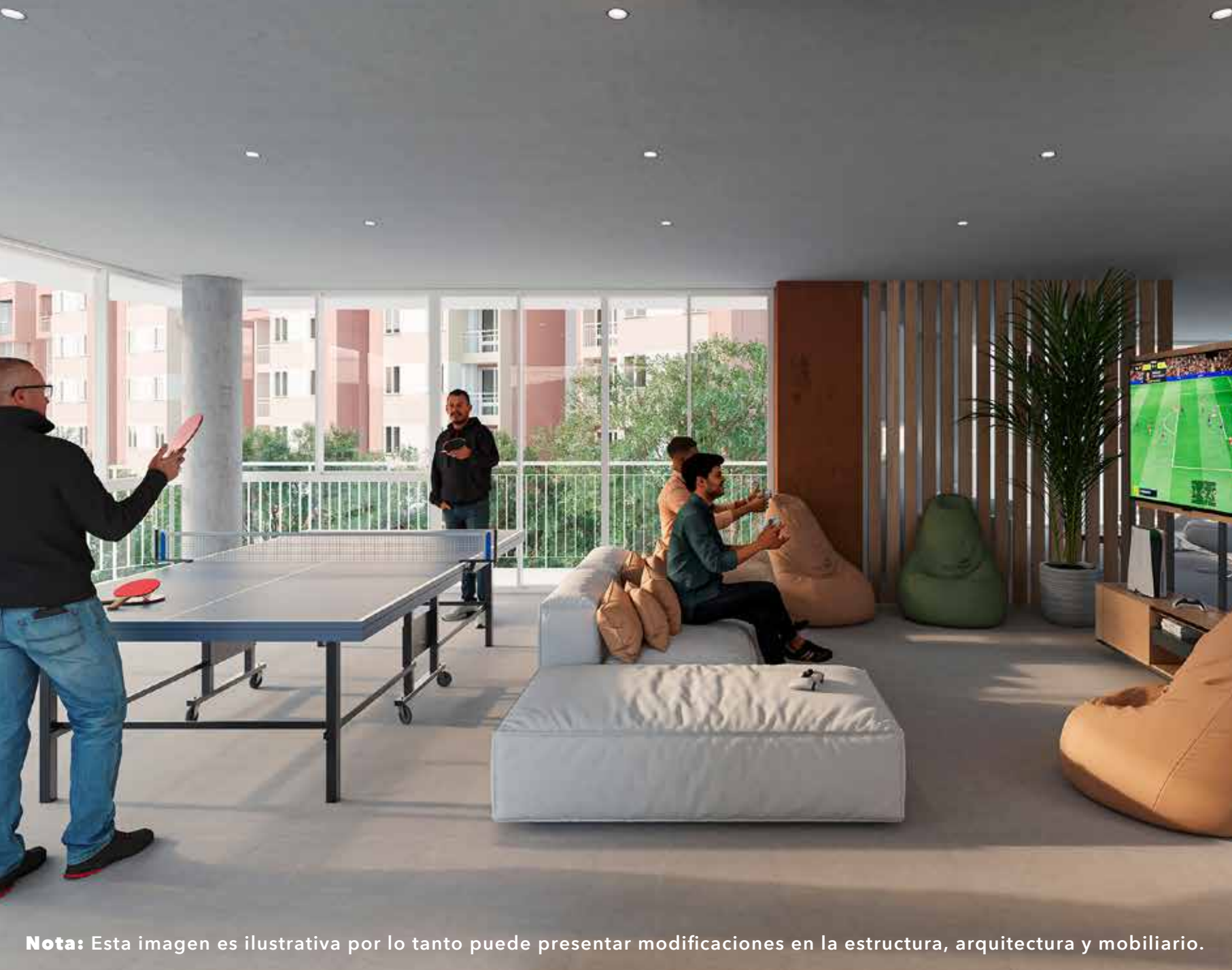
Nota: Esta imagen es ilustrativa por lo tanto puede presentar modificaciones en la estructura, arquitectura y mobiliario.