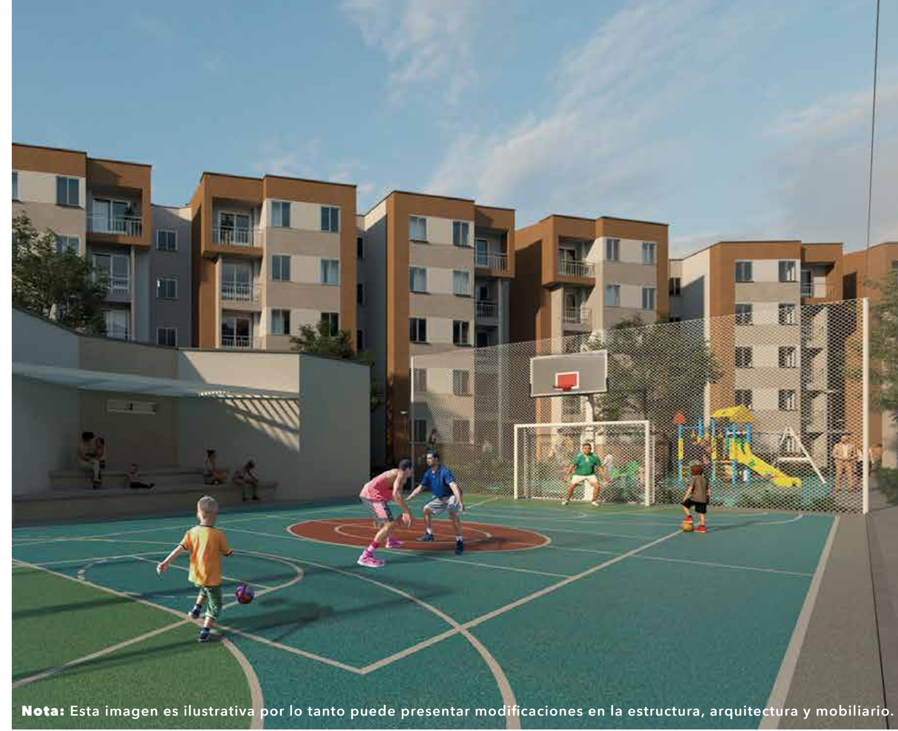
Nota: Esta imagen es ilustrativa por lo tanto puede presentar modificaciones en la estructura, arquitectura y mobiliario.