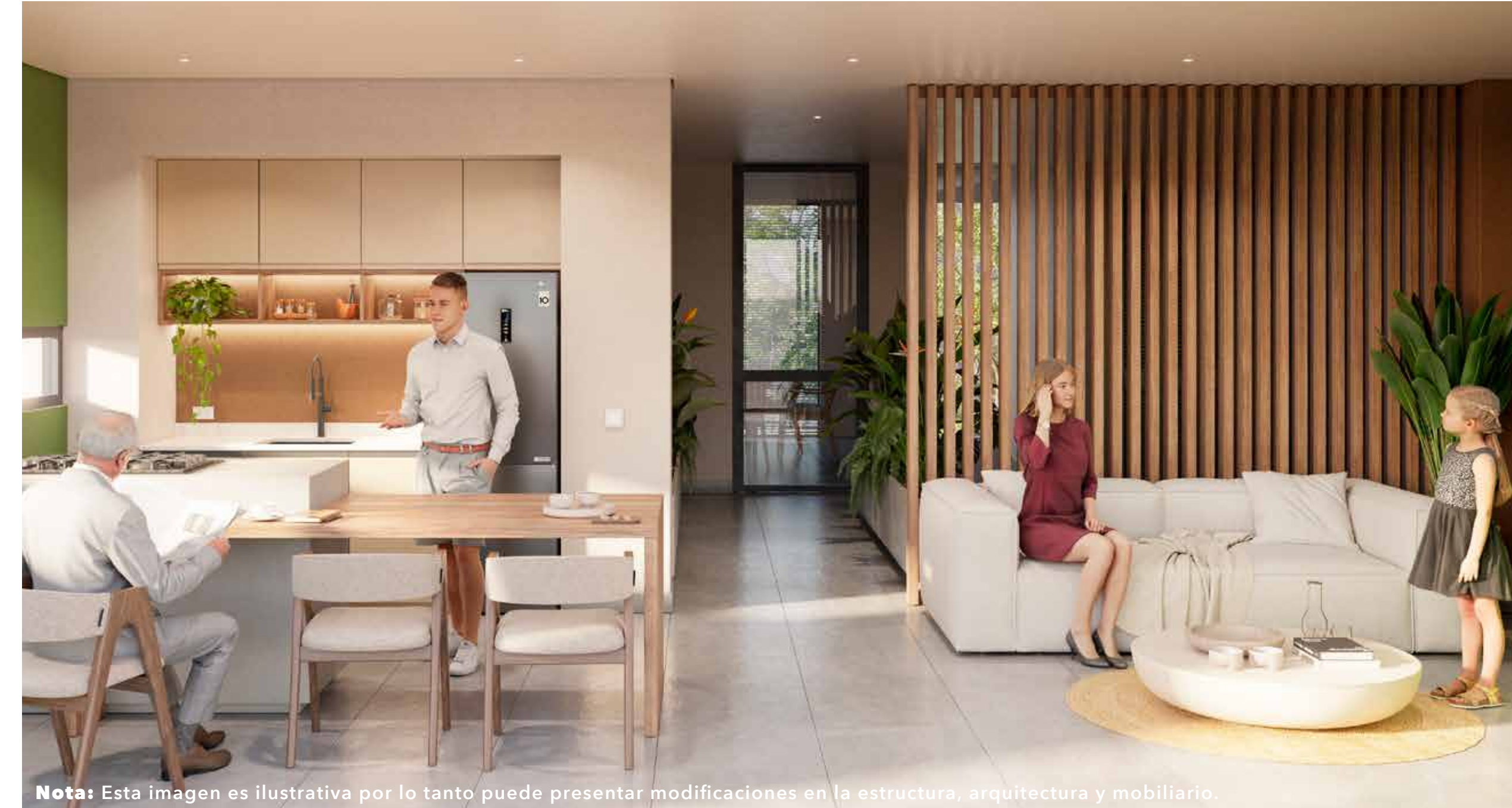
Nota: Esta imagen es ilustrativa por lo tanto puede presentar modificaciones en la estructura, arquitectura y mobiliario.