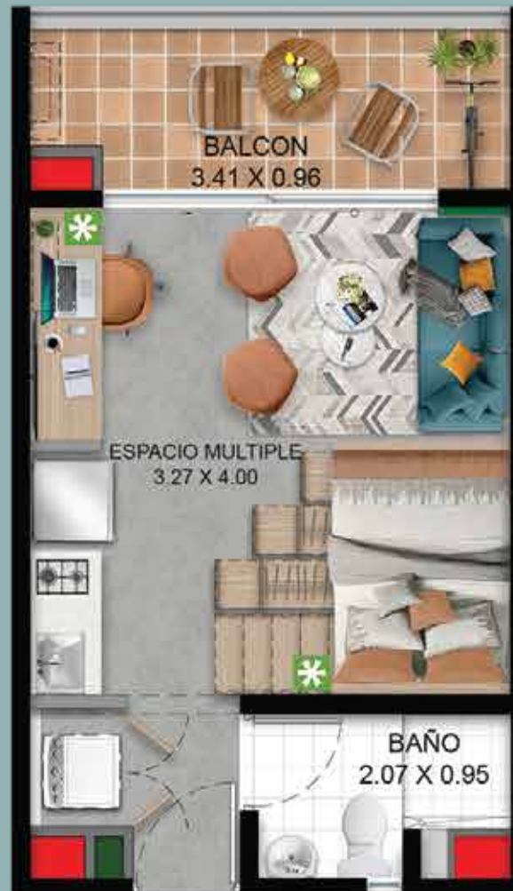
Opción 2 Futuro desarrollo