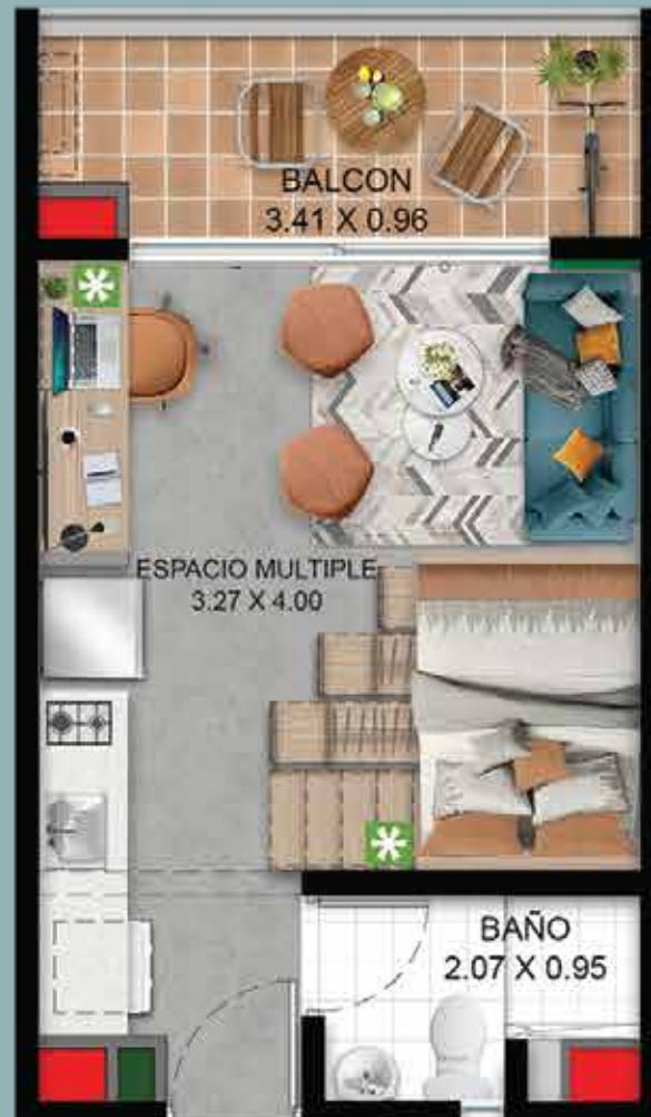
Opción 1 Futuro desarrollo