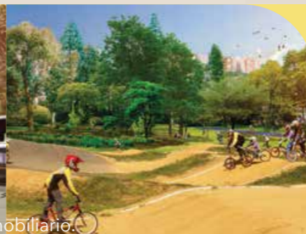
PISTA DE BICICROSS