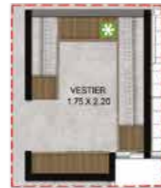
Opción Para Futuro Desarrollo Vestier - Estudio