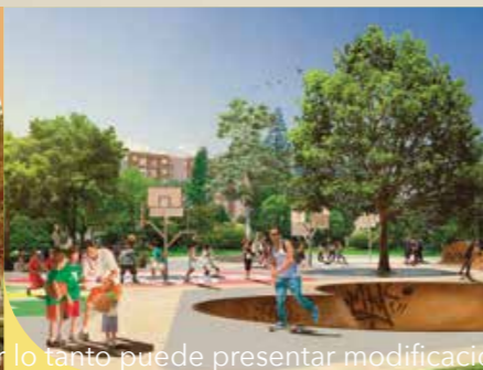
PISTA DE SKATE