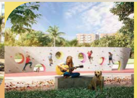
MURO DE ESCALADA

Nota: Esta imagen es ilustrativa por lo tanto puede presentar modificaciones en la estructura, arquitectura y mobiliario.