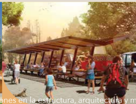
ZONA DE FOOD TRUCK