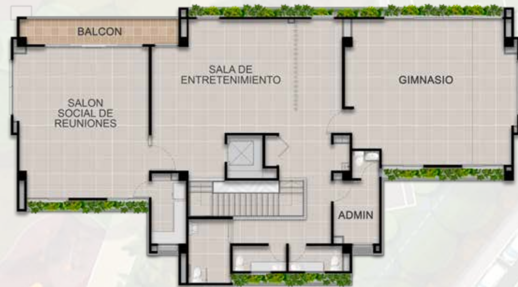
PLANO PISO 2 COLIVING