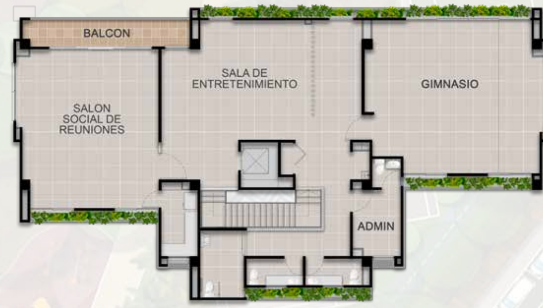
PLANO PISO 2 COLIVING