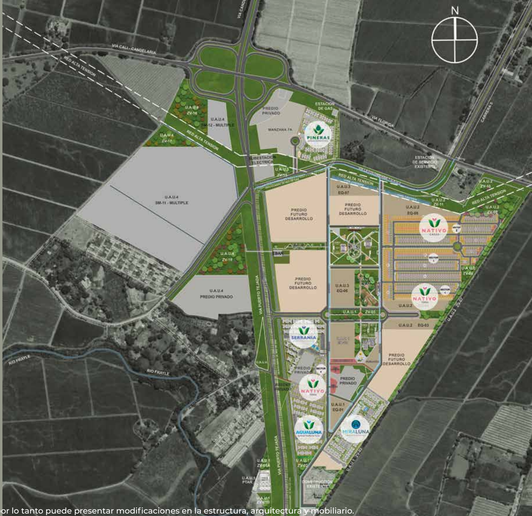
Nota: Esta imagen es ilustrativa por lo tanto puede presentar modificaciones en la estructura, arquitectura y mobiliario.