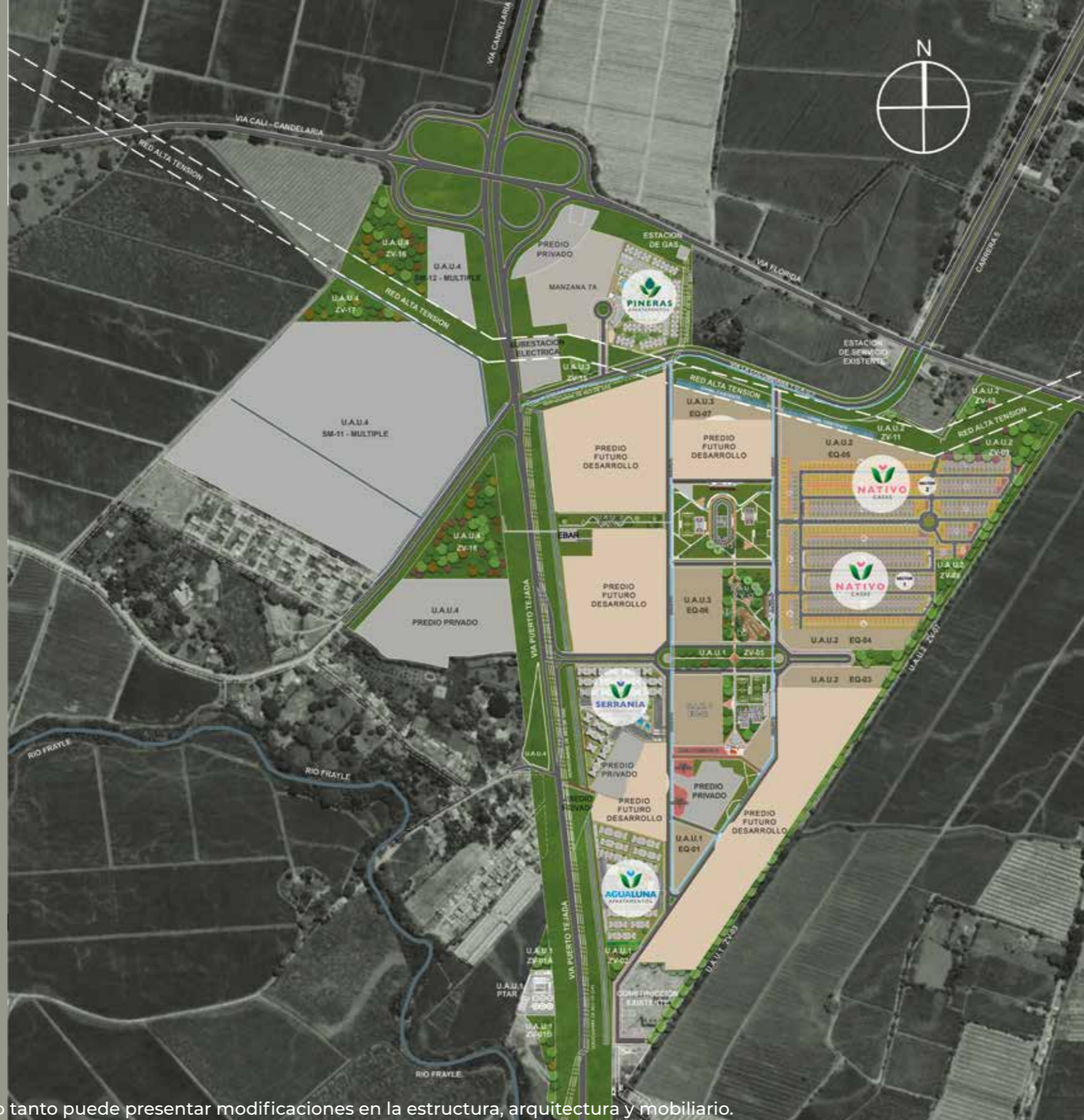
Nota: Esta imagen es ilustrativa por lo tanto puede presentar modificaciones en la estructura, arquitectura y mobiliario.