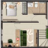
Idea de futuro desarrollo Piso 2 - Baño Alcobas y Vestier 2 en alcoba ppal