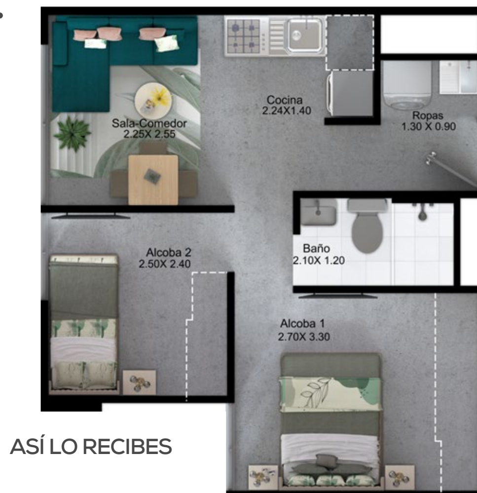
ASÍ LO RECIBES