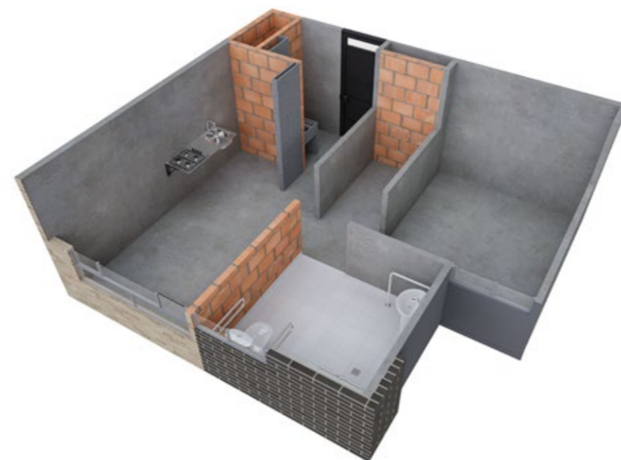
ASÍ LO RECIBES