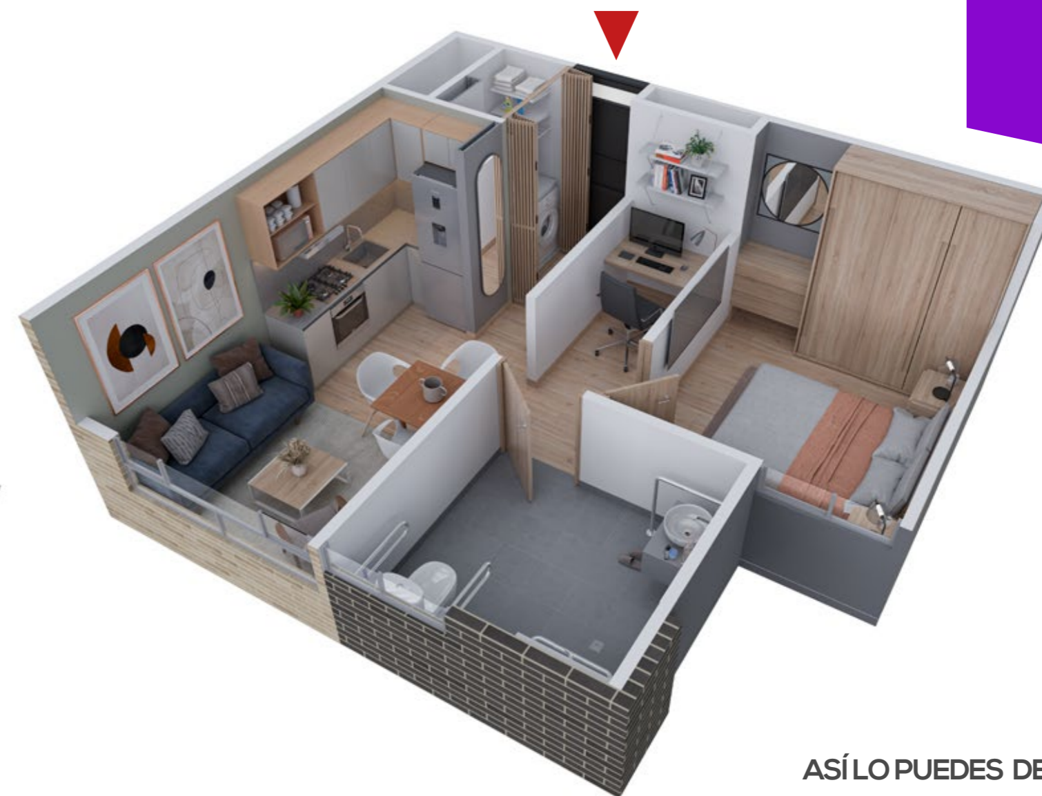
ASÍ LO PUEDES DEJAR