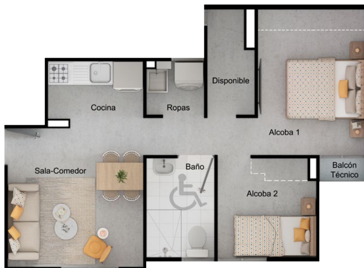
ASÍ LO RECIBES