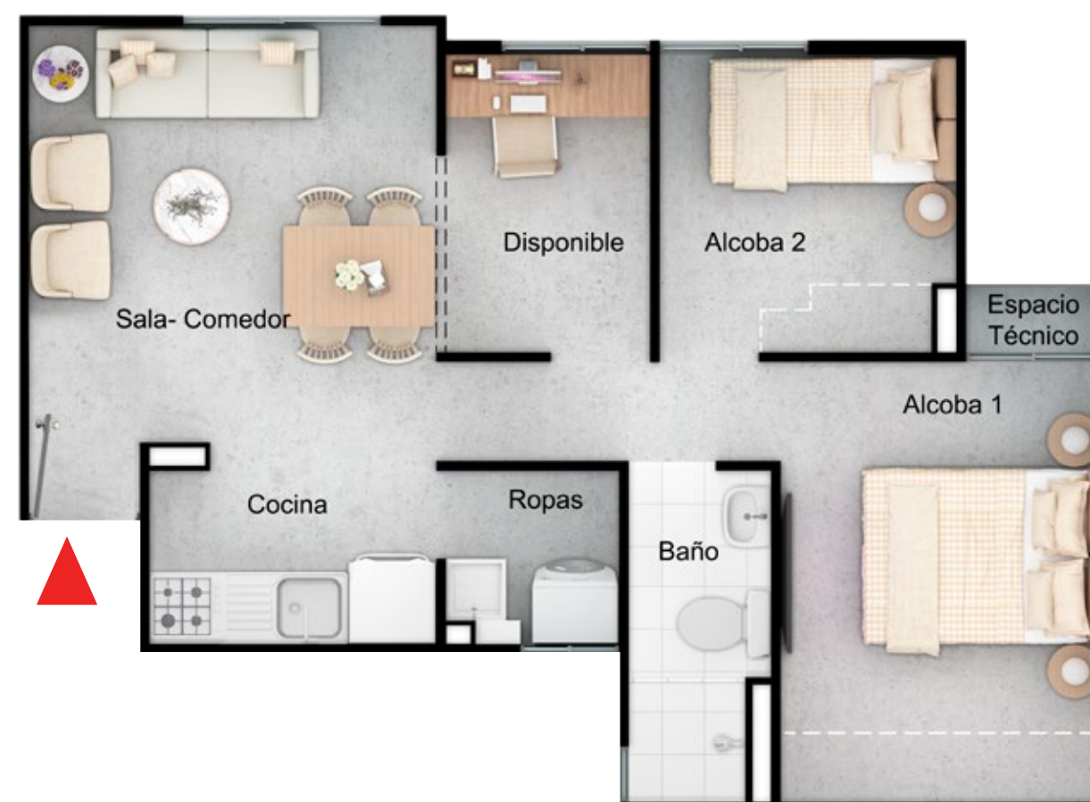
ASÍ LO RECIBES