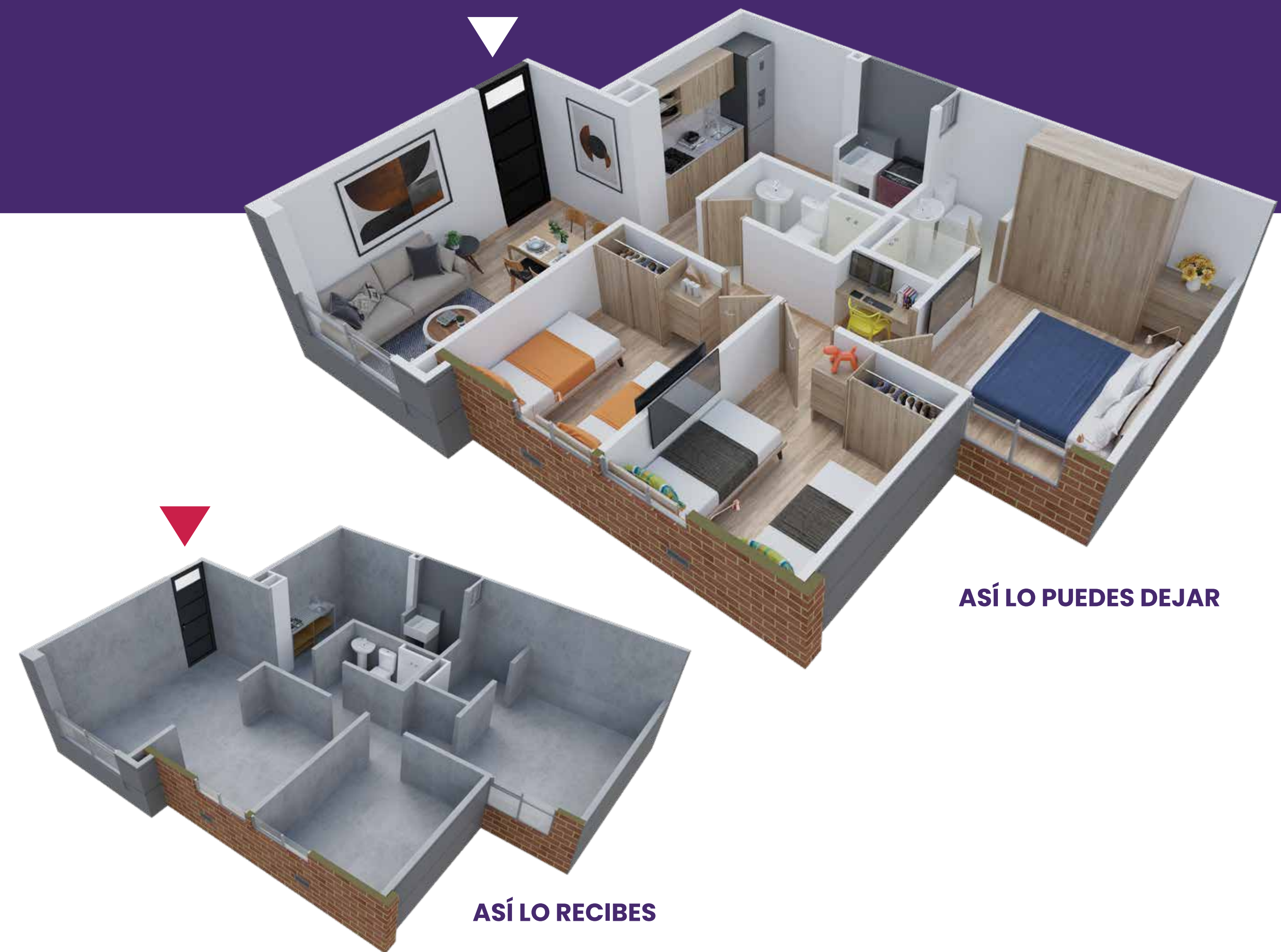
ASÍ LO PUEDES DEJAR