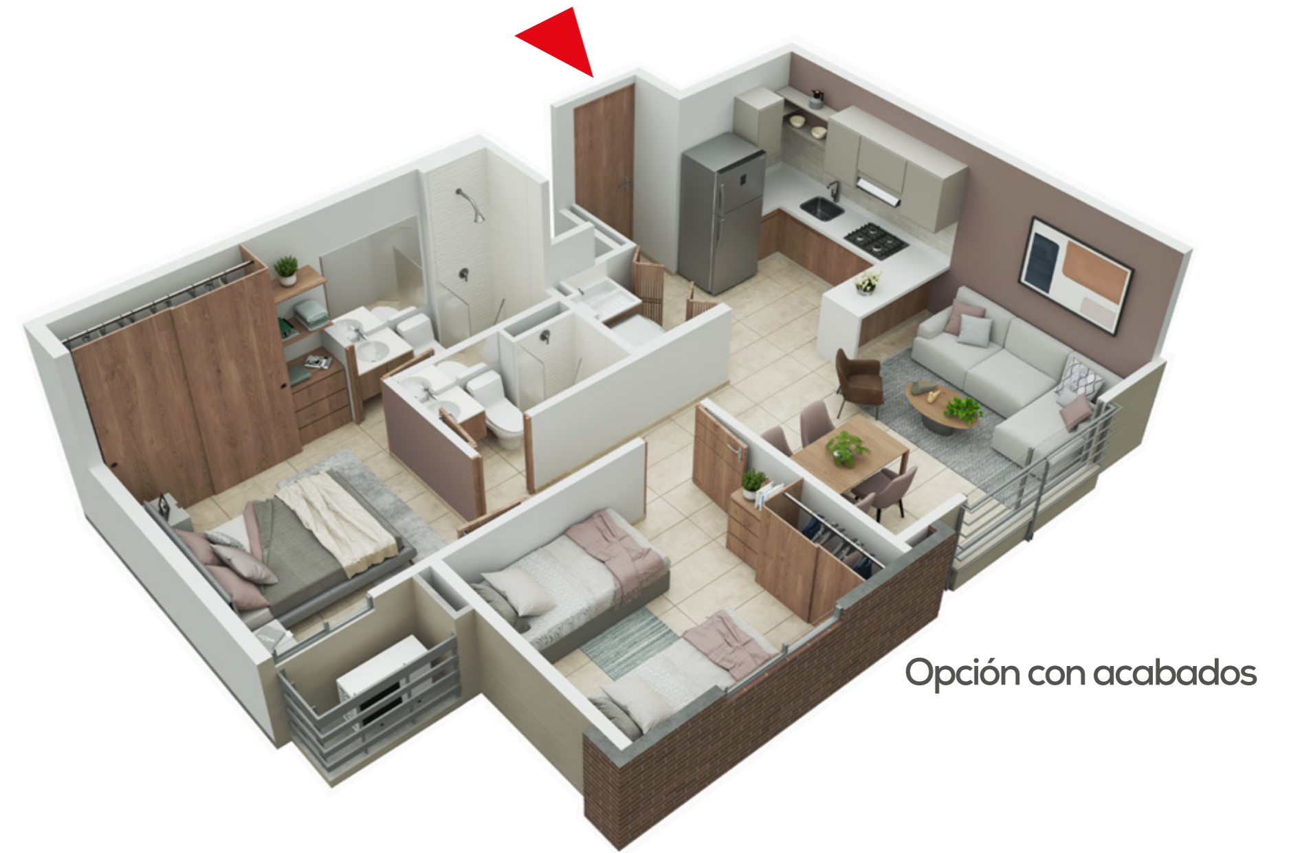
Opción con acabados