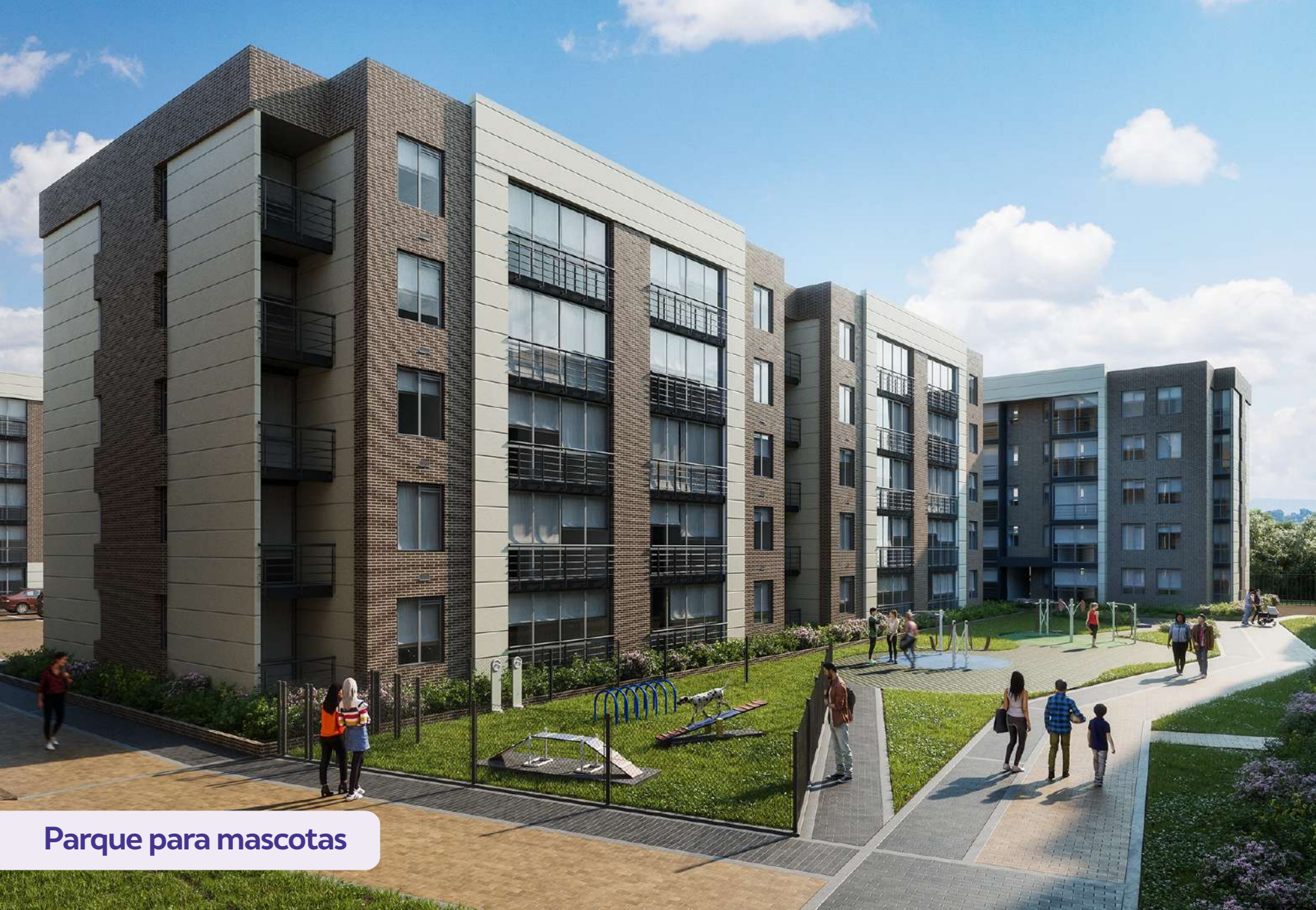
Parque para mascotas