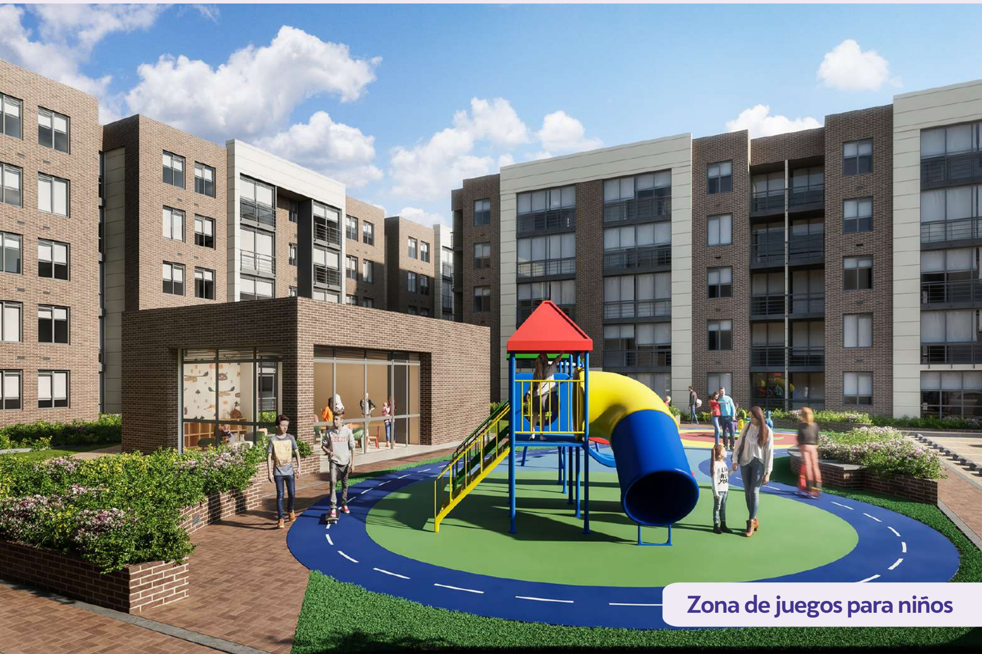
Zona de juegos para niños