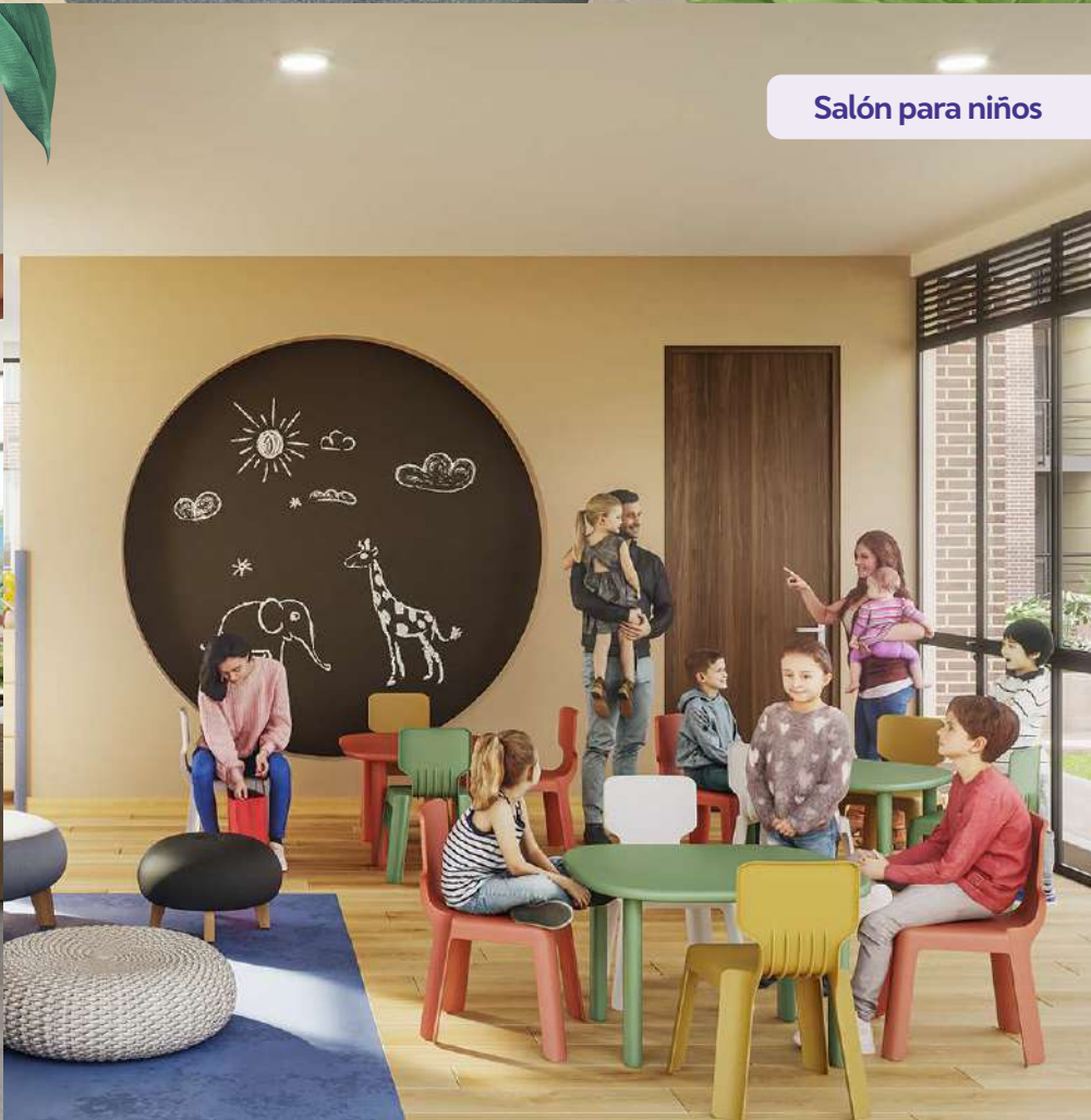
Salón para niños