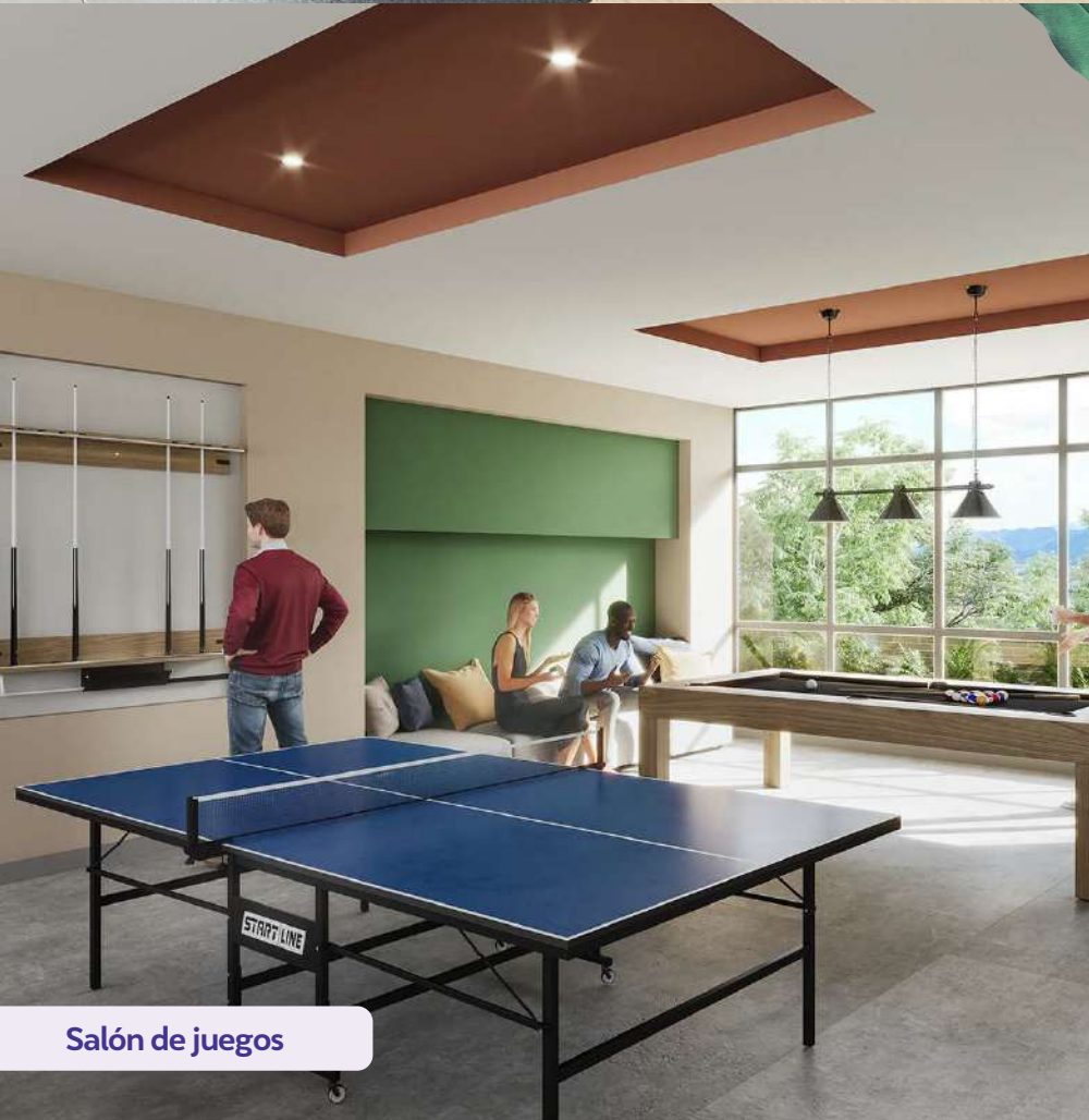
Salón de juegos