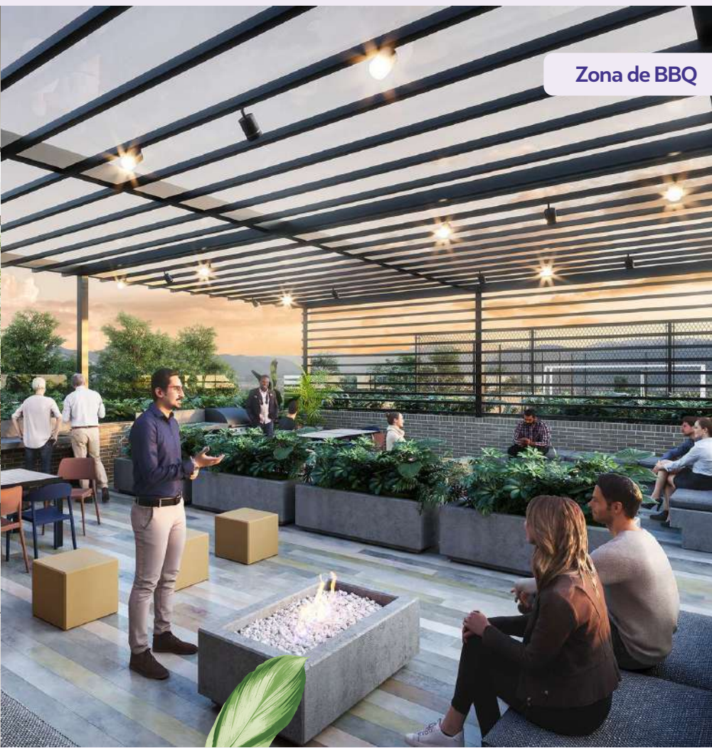
Zona de BBQ