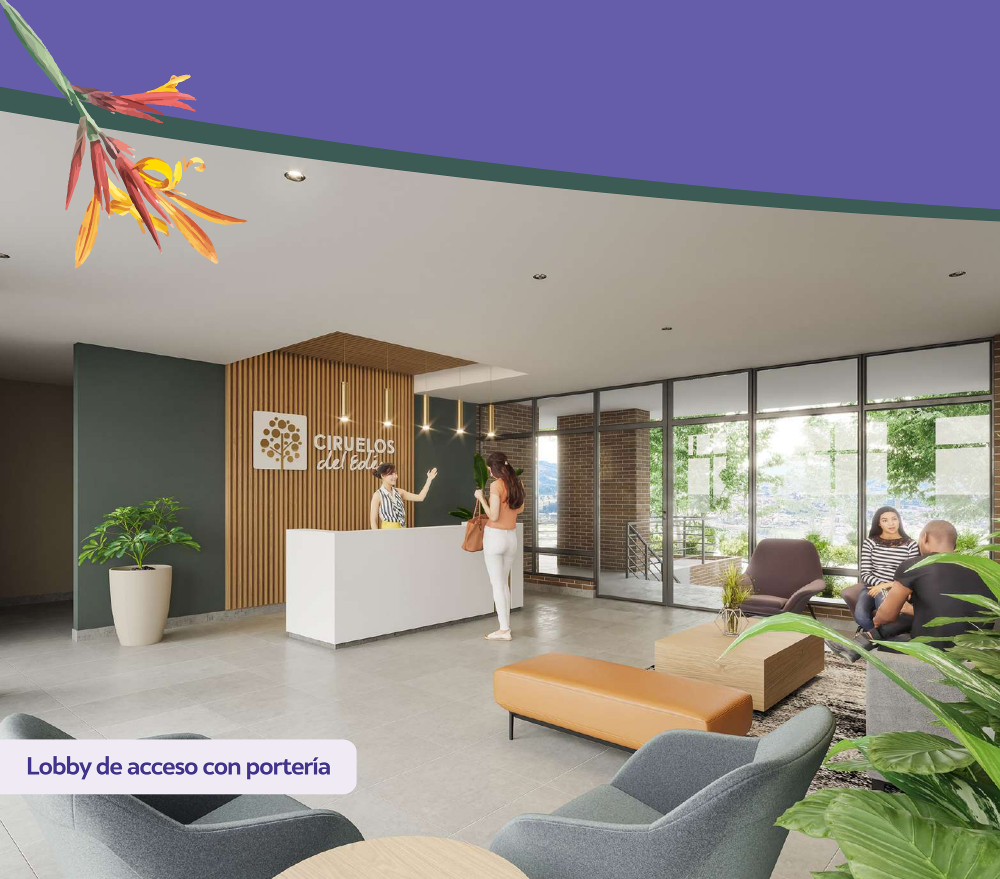
Lobby de acceso con portería